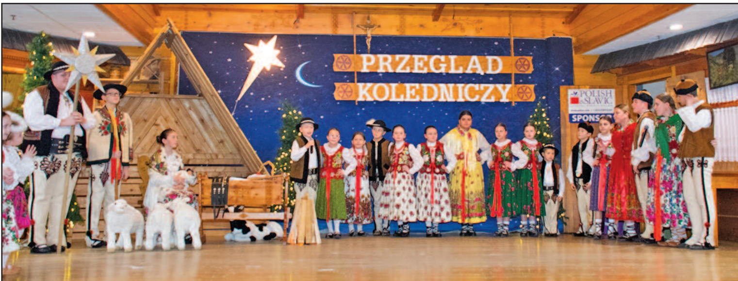
Szkołka Pieśni i Tańca przy Zarządzie Głównym ZPPA