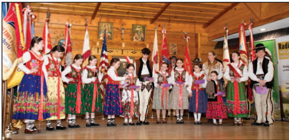
Program artystyczny w wykonaniu dzieci ze Szkoły Pieśni i Tańca przy ZG oraz młodzieży z zespołu Holni.

Opracowanie tekstu H. Studencka - korespondent ZPPA