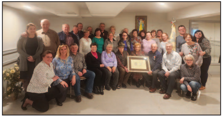
Za 50 lat działalności Polonijnej Kolo nr.27 Witow zostało uhonorowane przez Polskie władze Srebrnym medalem "Polonia Minor" Zebranie Kola 10 marzec 2024.