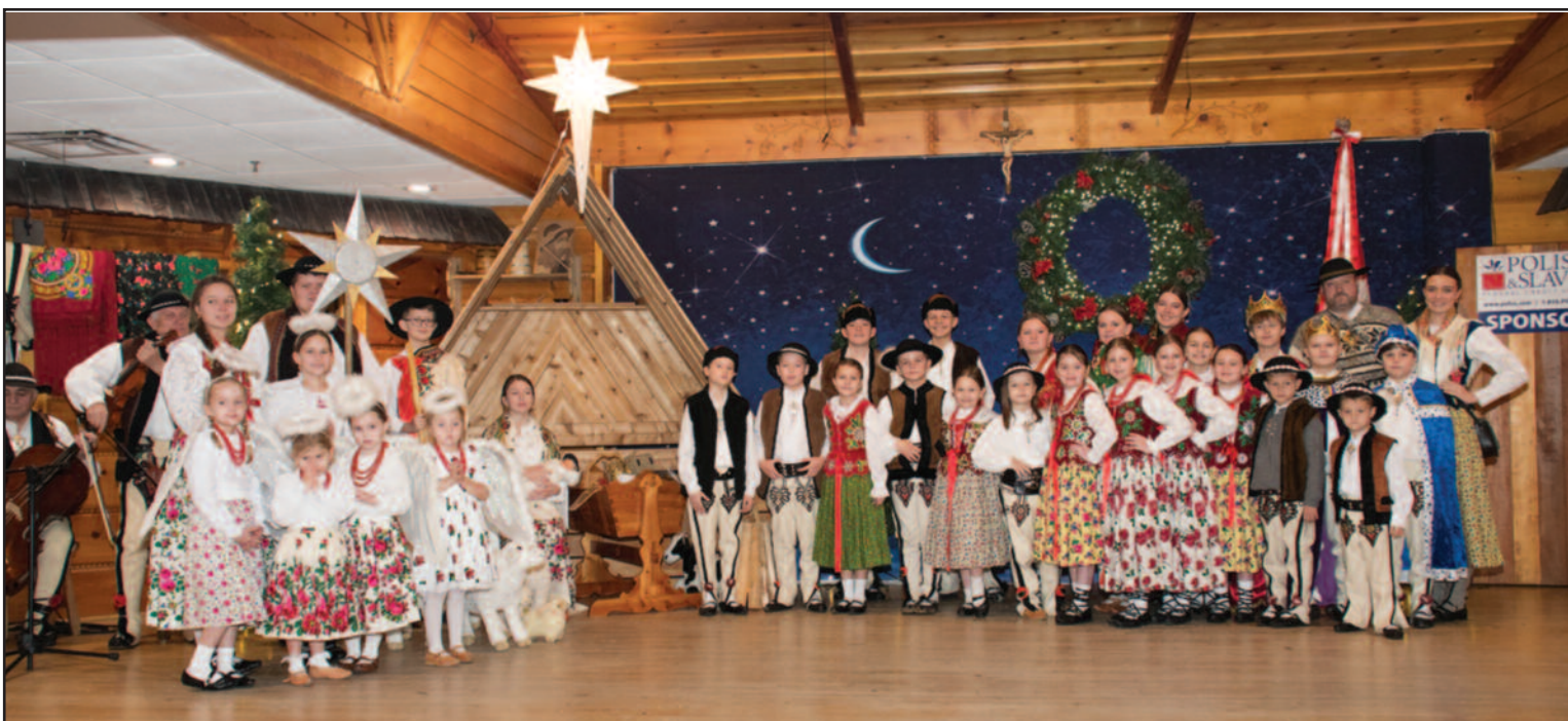
Jaselka wykonały dzieci ze Szkołki Pieśni i Tańca przy ZG