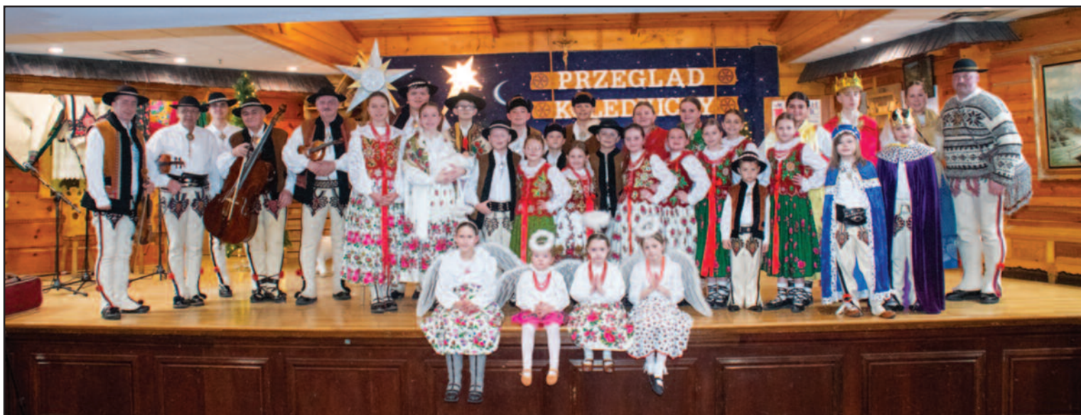
Szkołka Pieśni i tańca przy Zarządzie Głównym ZPPA