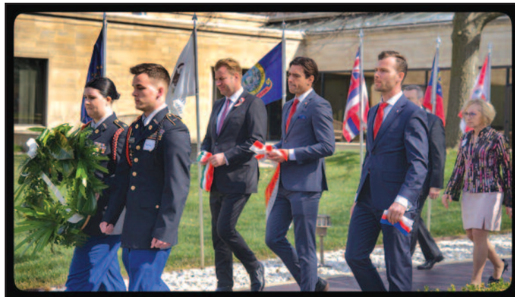
Złożenie kwiatów przez Konsuli