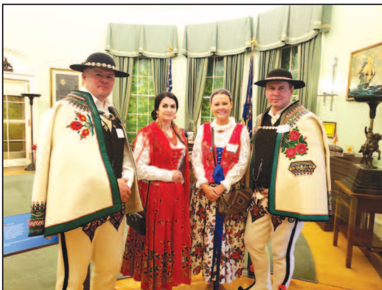
W muzeum Harrego Trumana