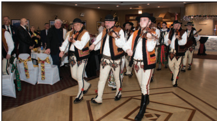
Uroczyste wejście z muzyką góralską

Ze śpiewem i muzyką, uroczystym wejściem z "gwiazdą" w asyście Zarządu Głównego i zaproszonych gości, rozpoczął się OPŁATEK ZPPA 2024!