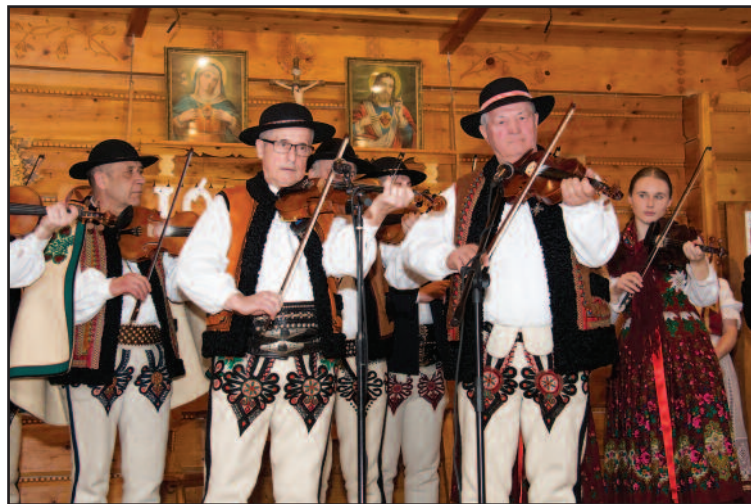
Wspólne muzykowanie odznaczonych.