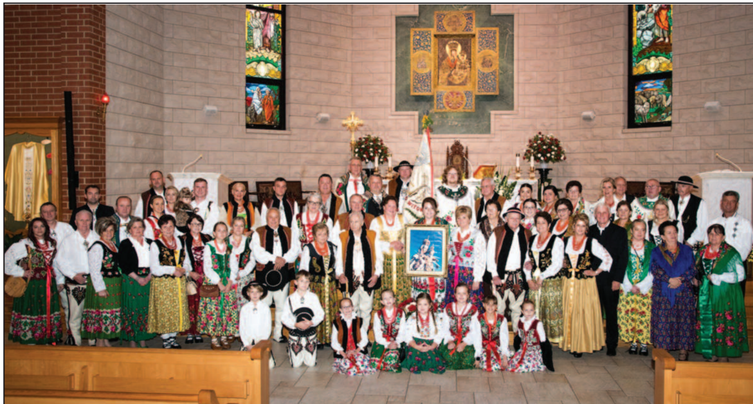
Po Mszy Sw Jubileuszowej 50-lecia Kola Nr.27 Witow, 14 pazdziernik 2023