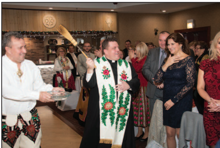
Wody święconej nie zabrakło też dla gości.