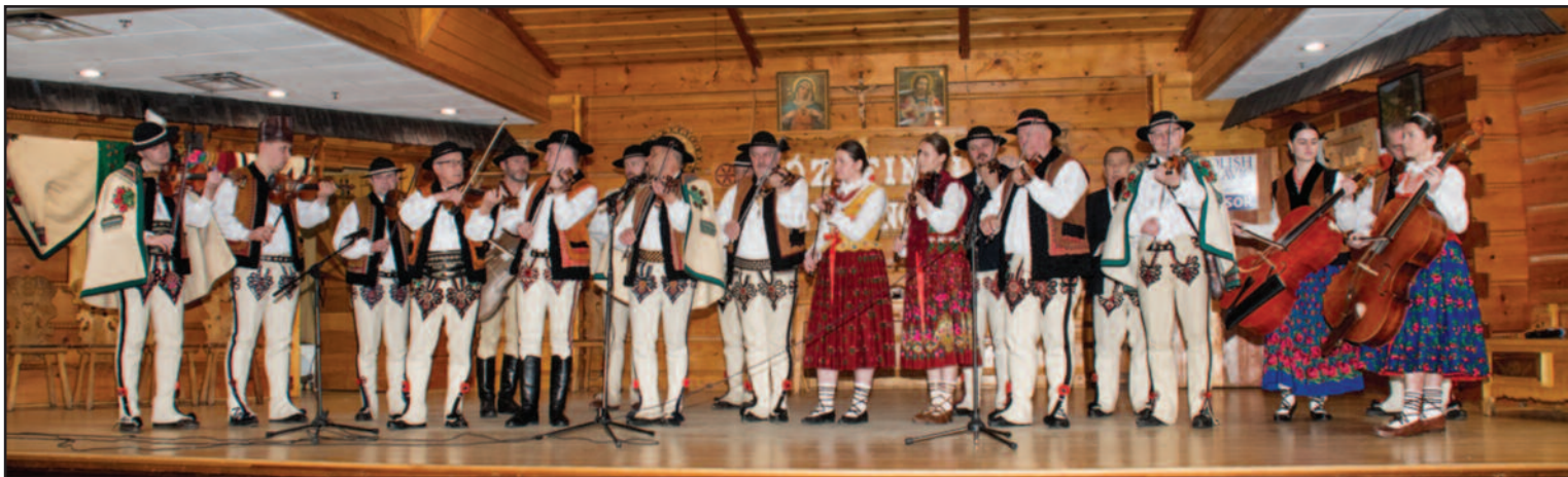
Uroczyste rozpoczęcie Józefinek Muzykanckich.