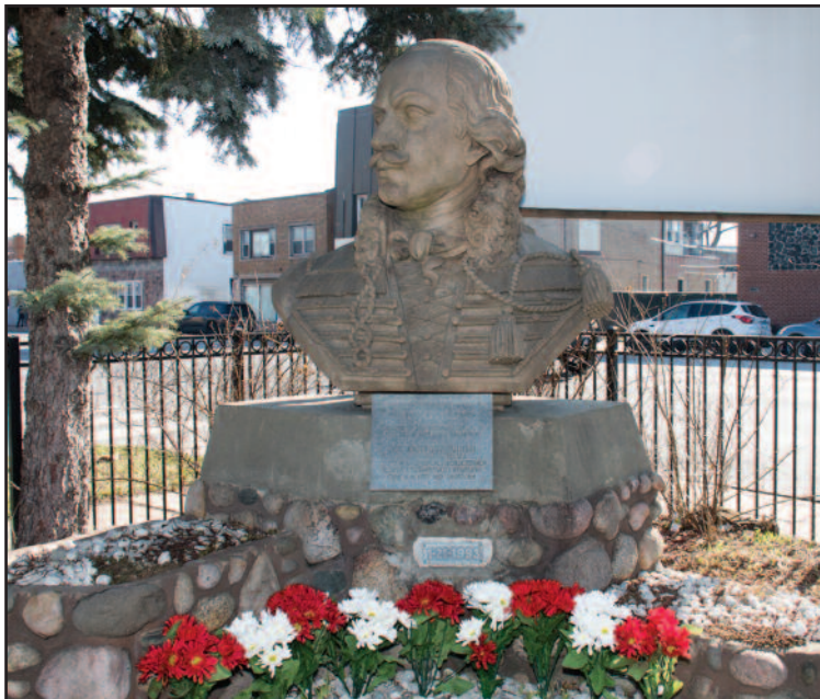
Pomnik Kazimierza Pułaskiego w ogrodzie Domu Podhalan

Polonia w Chicago uroczystie świętowała Dzień Gen Kazimierza Pułaskiego.