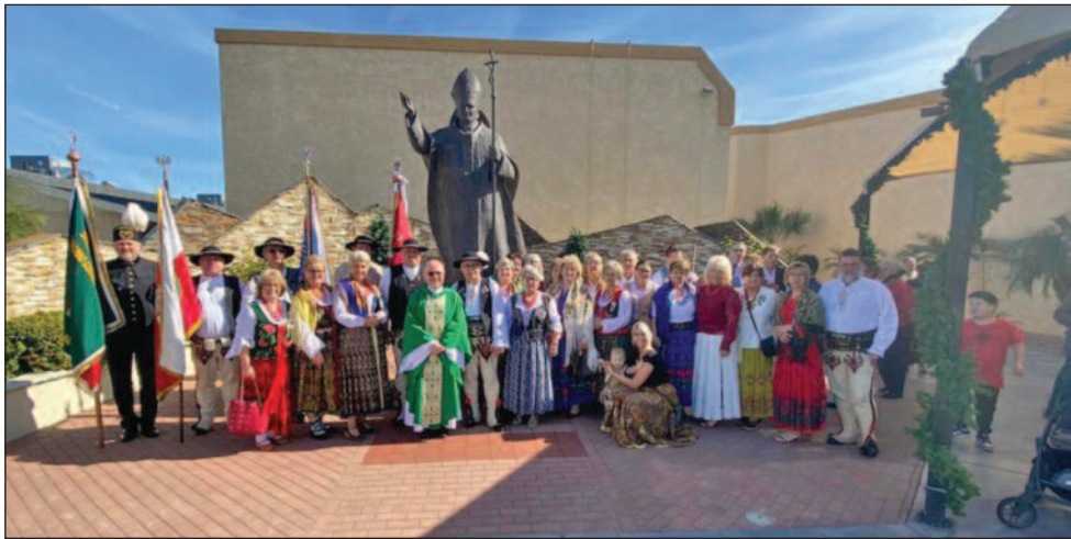
Uczestnicy uroczystości 25-lecia istnienia Koła nr 70 Podhalanie w Arizonie

Uroczysty bankiet z okazji 25 - lecia działalności Związku Podhalan w Arizonie odbył się 27 stycznia 2024 roku o godz 7.00 PM PULASKI CLUB 4331 E McDowell Rd Phoenix, Arizona 85002