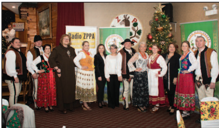
Zarząd Główny z przedstawicielami PSFCU