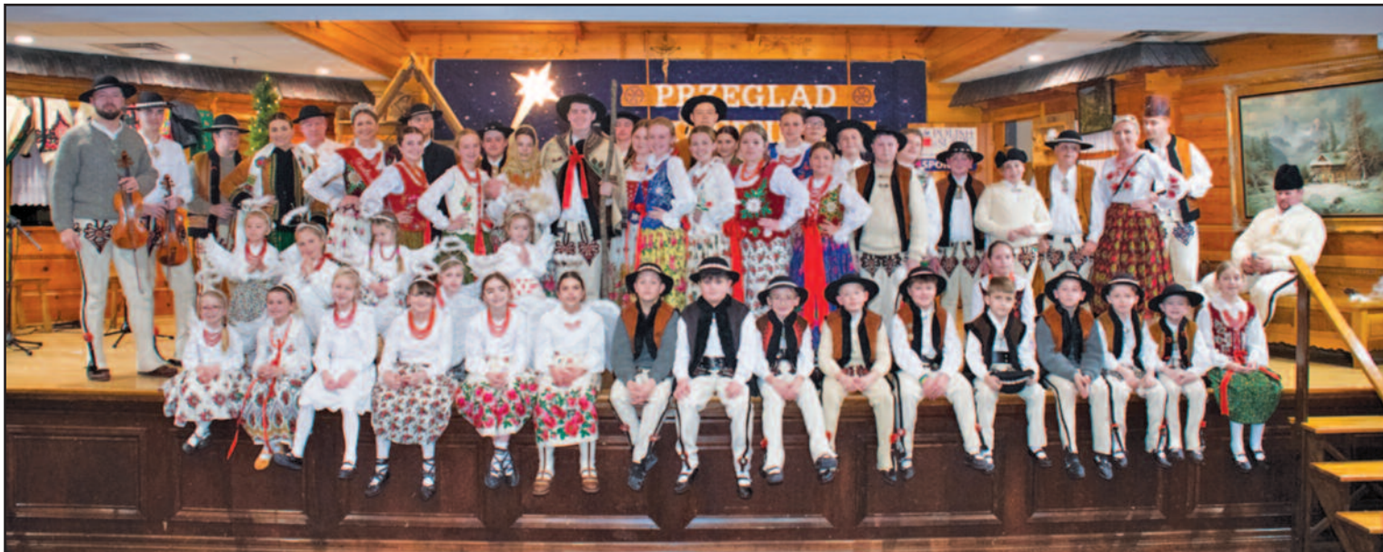
Mali i Młodzi Siumni