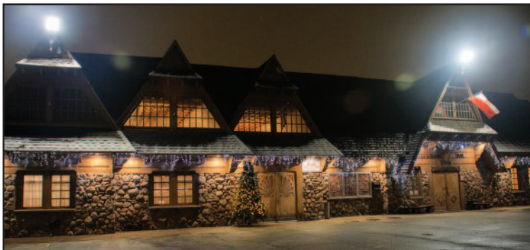
Dom Podhalan – siedziba górali podhalańskich w USA

"Przybieżeli do Betlejem pasterze, grają skocznie Dzieciąteczku na lirze, Chwała na wysokości, a pokój na ziemi....."