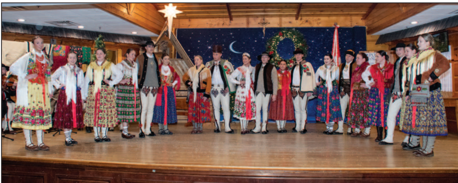
Wystąpił zespół reprezentacyjny SIUMNI