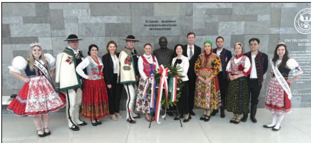
Delegacje Czech, Węgier i Polski