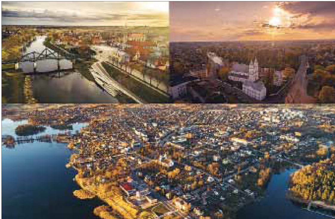
Fotokolaż od lewej: Kiejdany (fot. Irmantas Gelūnas), Poswole (fot. Aldas Vaitaitis) i Jeziorosy (fot. Irmantas Gelūnas)

Przedstawiciele resortu kultury podkreślają, że bardzo ważne i konsekwentne jest również zwracanie uwagi przez władze lokalne na kulturę i sztukę, miejscowych twórców i społeczność kulturalną. Cieszy go to, że w przyszłych Litewskich Stolicach Kultury harmonijnie rozwijane są różne for-