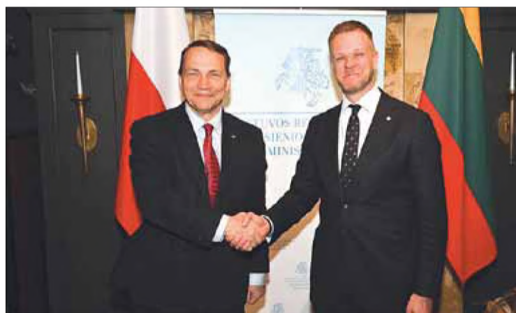
Ministrowie spraw zagranicznych Polski i Litwy podczas konferencji Snow Meeting, poświęconej kwestiom bezpieczeństwa

Na marginesie konferencji, szef polskiej dyplomacji spotkał się z ministrem spraw zagranicznych Litwy Gabrieliusem Landsbergisem. Ministrowie omówili najistotniejsze kwestie z zakresu bezpieczeństwa, wsparcia dla Ukrainy, podkreślając konieczność zapewnienia długoterminowej pomocy finansowej i woj-