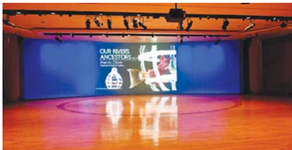
Wystawa w National Museum of American Indian