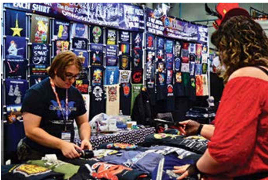
ComicCon w Javits Center

A już 17 października party otwierające OHNY w United Palace przy Broadway&West 175th Street . Koncert i inne atrakcje. Oczekiwany dress code: bizantyjski, romański, indyjsko-hinduistyczny, chiński, mauretański, perski, eklektyczny, rokoko i déco strój odświętny.