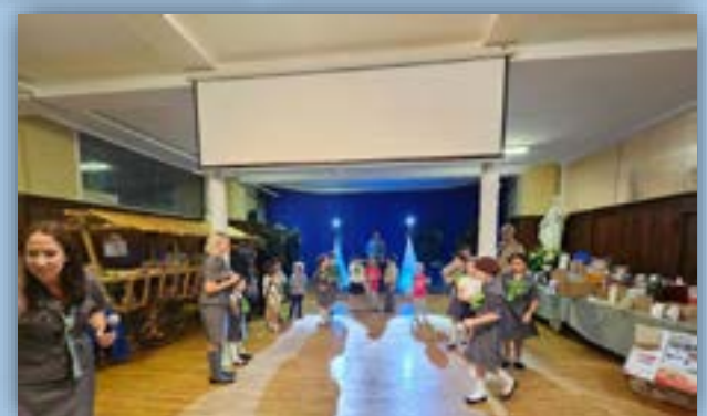
Opracowanie i zdjęcia Andrzej Węciorkowski