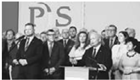
Jarosław Kaczyński i kluczowi politycy PiS

PiS wciąż poszukuje kandydata na prezydenta w wyborach 2025. Kilka tygodni temu w mediach pojawiła się sensacyjna wiadomość, że Jarosław Kaczyński brał pod uwagę prezydenta Światowej Agencji Antydopingowej (WADA) i byłego ministra sportu Witolda Bańkę. Teraz sam zainteresowany to potwierdził.