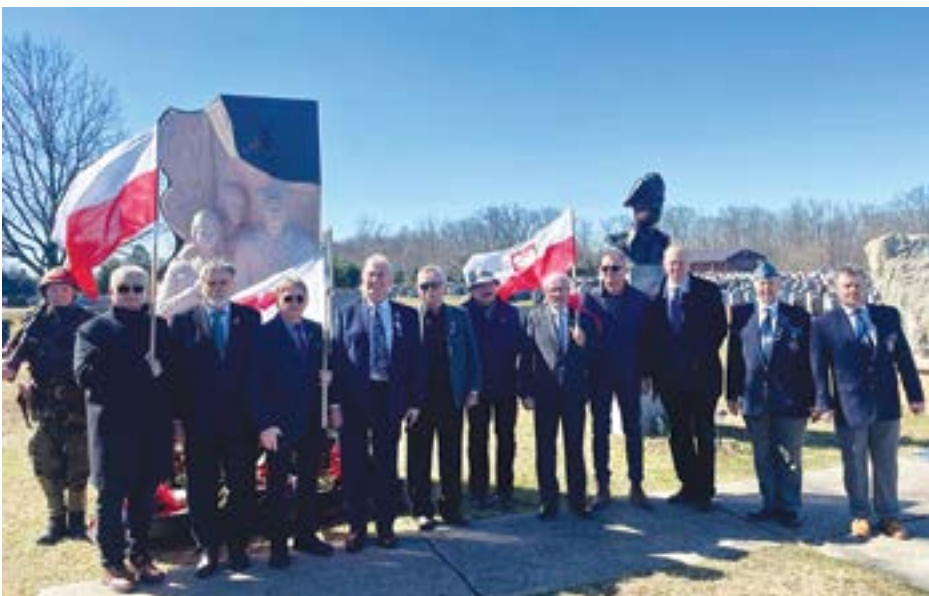
Działacze Stowarzyszenia Freedom and Solidarity