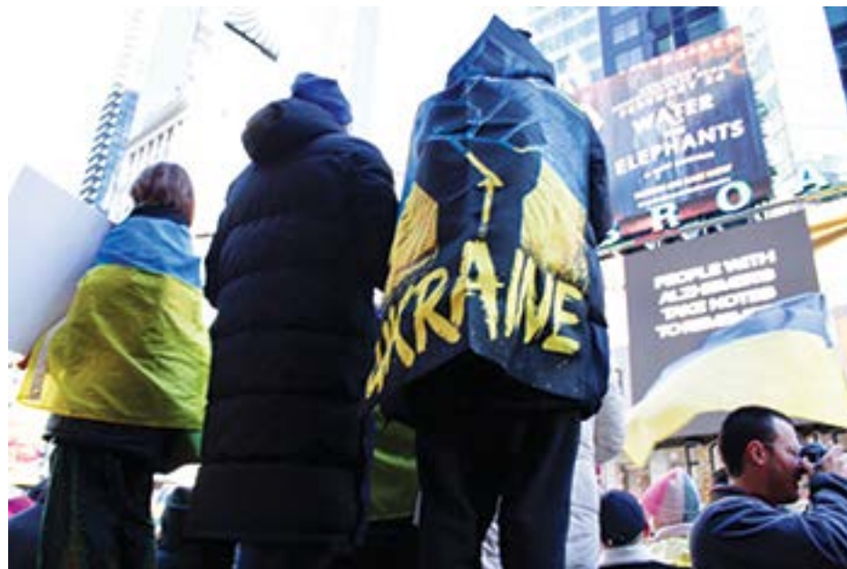
Demonstracja przeciwko wojnie w Ukrainie na Times Square

* Gubernatorka NY Kathy Hochul ogłosiła, że wzmocni w metrze funkcjonariuszy Gwardii Narodowej i policji stanowej, aby zwiększyć bezpieczeństwo pasażerów. Docelowo metro ma być chronione przez 750 gwardzistów i 250 pracowników ochrony.