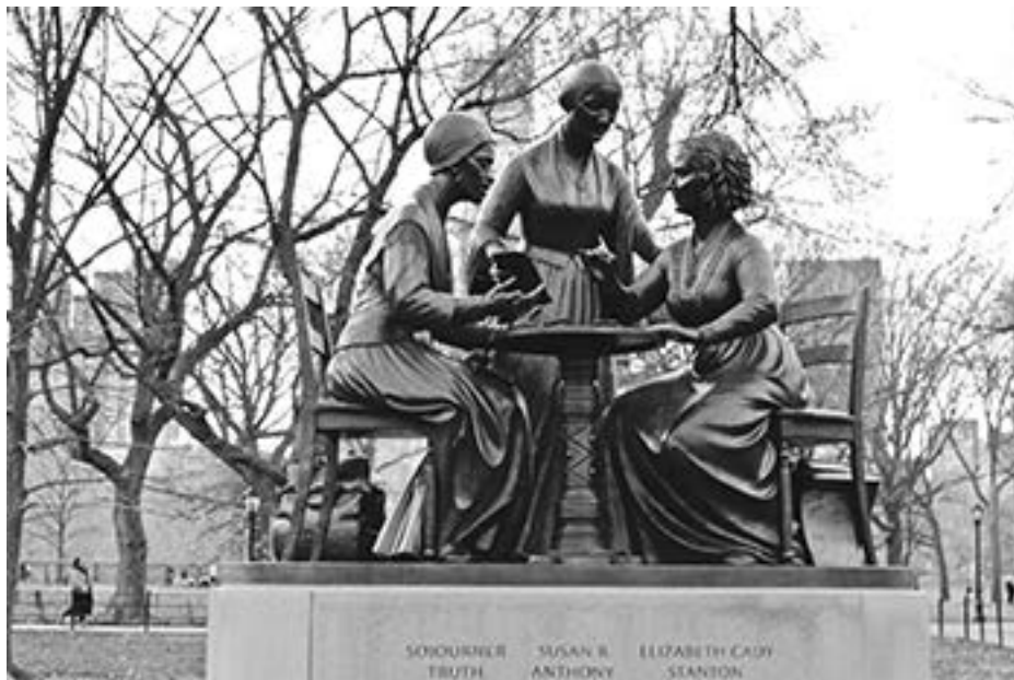
Pomnik pierwszych amerykańskich sufrażystek w Central Park

Nie jest też szczególnie znany fakt, że pierwsze sufrażystki- w tym obecna na pomniku E.C Stanton i nieobecna Matilda Gage- poznawały, badały i opisywały życie Indianek, jak wtedy były nazywane rdzenne mieszkanki. Gage napisała na ten temat książkę i wiele artykułów i zorganizowała serię spotkań w trakcie których przekazywała innym kobietom swoje obserwacje i podziw. Była zafascynowana i entuzjastycznie pisała o tym, że "kobieta indiańska ma władzę absolutną w rodzinie" i jest na równi odpowiedzialna za wszystkie podejmowane wspólnie decyzje. „Jeśli z jakiegoś powodu mąż i żona Irokezów rozstają się, żona zabiera ze sobą cały