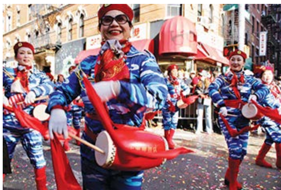
Marching band z Singapuru w trakcie parady w Chinatown