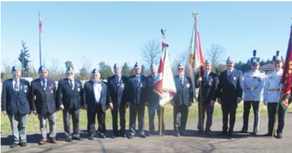
Weterani w szyku przed składaniem wieńców