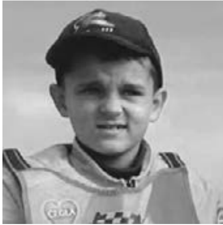
Na zdjęciu: Bartosz Zmarzlik jako dziecko

Chyba nie ma w Polsce osoby, która nigdy nie słyszała jego nazwiska. Poznajesz kto jest na zdjęciu? Podpowiedz: wielki sportowiec.