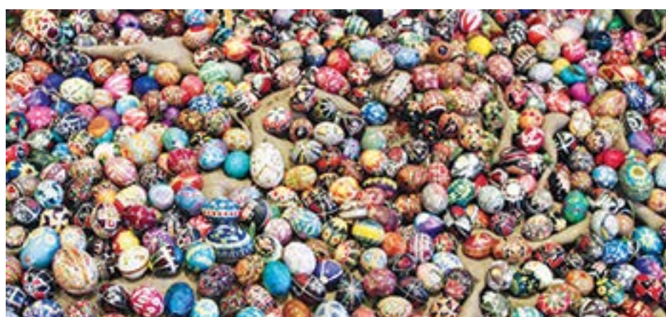
Instalacja z pisanek w Ukrainian Institute of America