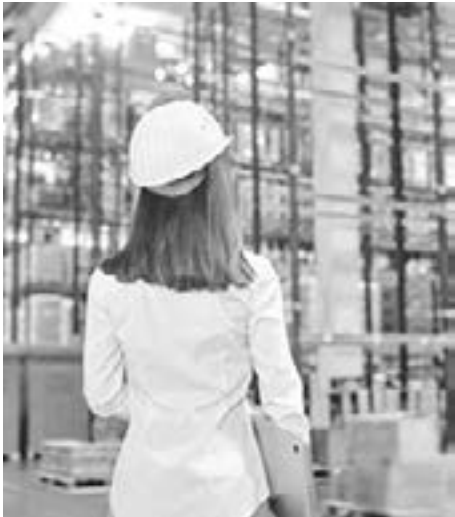
Słynna polska firma ogłosiła upadłość. To koniec legendarnej marki?

Legendarna polska firma ogłosiła upadłość i została wystawiona na sprzedaż. Chodzi o najstarszą firmę zajmującą się produkcją silników i maszyn rolniczych. Licytacja została zaplanowana na marzec, a jej nowy właściciel będzie mógł ją reaktywować. Przedstawiamy szczegóły.