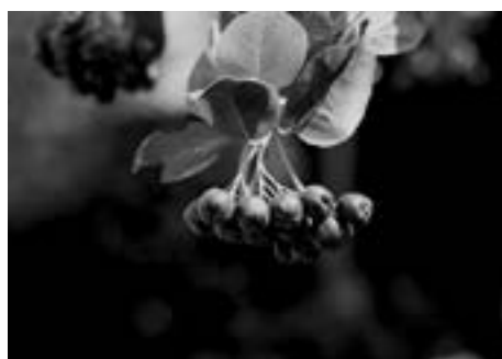
Owoce aronii dostarczają organizmowi niezbędne witaminy

Trudno zmierzyć potężny wachlarz właściwości zdrowotnych aronii. Wiadomo jednak, że włączenie jej do codziennego jadłospisu niesie za sobą wiele korzyści. Te małe, niepozorne i przypominające borówkę owoce kryją w sobie wielką moc. Jak najlepiej wykorzystać zebrane lub kupione owoce, by wspomagać organizm w zdrowy i pyszny sposób? Wypróbuj sprawdzone przepisy.