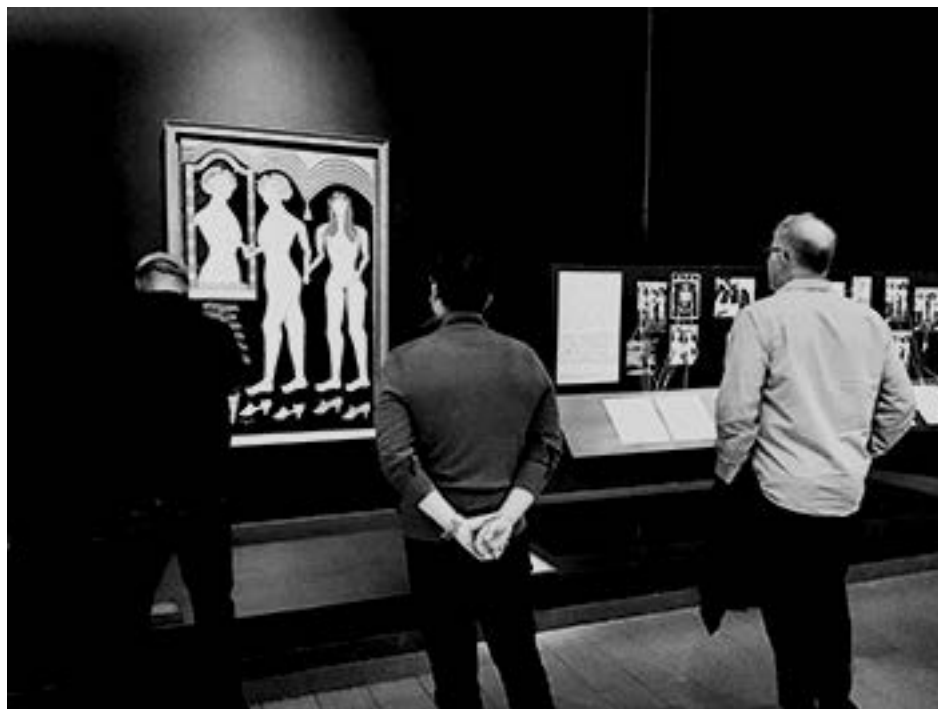
Część wystawy w American Folk Art Museum

Gubernatorka stanu NY i burmistrz NYC zdecydowali, że każdego dnia 1200 policjantów będzie skierowanych do ochrony metra. I rzeczywiście, policję widać przed stacjami, na stacjach i w wagonach. Co jakiś czas przez megafony pojawiają się informacje o obecności NYPD i informacja, że policjanci są po to,