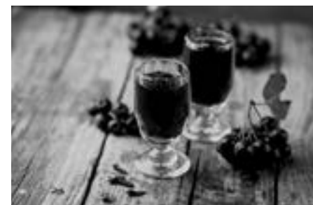
Nalewkę z aronii warto przygotować właśnie jesienią

500 g owoców aronii 500 ml spirytusu rektyfikowanego