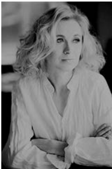
Bohaterką książki jest „Lucy” - Lucyna von Bachman, primo

Manuela Gretkowska w swojej książce pt. „Mistrzyni” z podtytułem „Powieść inspirowana życiem Lucyny Ćwierczakiewiczowej”, próbuje pokazać fragment życia kobiety, niezwykle popularnej w XIX-wiecznej Warszawie jako autorki przepisów kulinarnych.