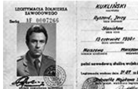
„Żołnierz” Układu Warszawskiego

„Nie jest alternatywą komunizm czy kapitalizm, lecz służba narodowi czy sowieckiemu imperium” (tak wyraził się Kukliński w „Tygodniku Solidarność” z 1994.