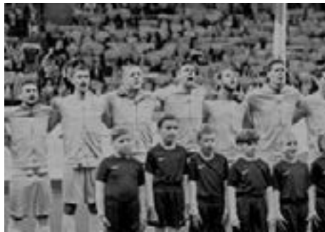
Na zdjęciu: reprezentacja Polski

FIFA porozumiała się z rosyjską stacją Match TV w sprawie transmisji mistrzostw świata w Katarze. Minister sportu Kamil Bortniczuk w rozmowie z Radiem Zet powiedział, że mimo to Polska nie powinna bojkotować nadchodzącego mundialu.