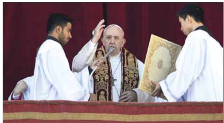
Na zakończenie orędzia Franciszek udzielił błogosławieństwa Urbi et Orbi, czyli miastu i światu.

– Wpatrując się w Dzieciątko Jezus błagam o pokój dla Ukrainy. Odnówmy naszą duchową i ludzką bliskość z jej udręczonym narodem, aby dzięki wsparciu każdego z nas mógł odczuć konkretność Bożej miłości – powiedział. – Niech nasze spoj-