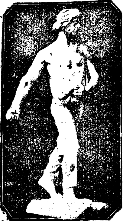
Model pomnika polskiego na Centenario Brazylii.

Adres dla listów: — Curitiba, Caixa Postal 155 — Adres Redakcji: Curitiba, Avenida: Dr. Jayme Reis 115. — Paraná, Brasil.