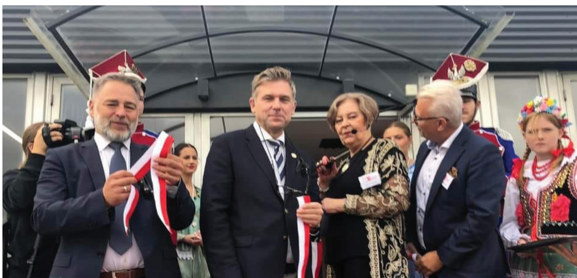
Wstęga przecięta, Dom Polonii „Kopernik” otwarty.