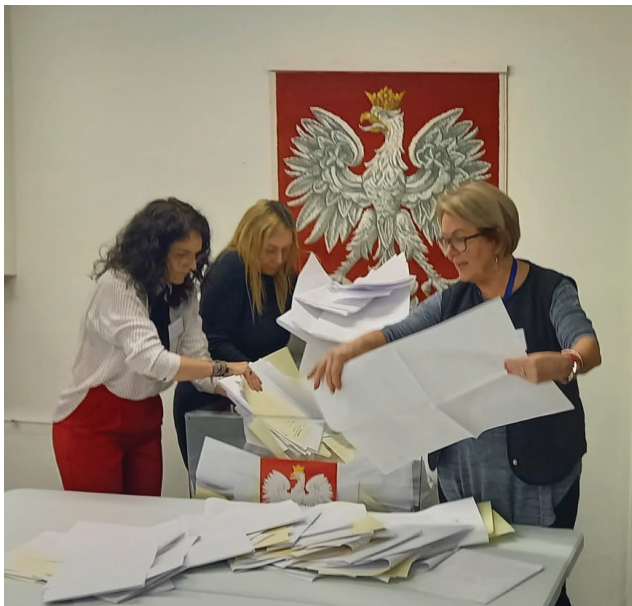
Lokal wyborczy zamknięty, można zacząć liczyć głosy. Vallokalen stängd, man kan börja räkna rösterna.

zamieszkującym południową Szwecję, gdyż temperatura była bardzo niska, a odczucie zimna potęgował dodatkowo bardzo silny wiatr. Nie zmieniało to faktu, że wyborcy wchodzili do „Kopernika” uśmiechnięci i życzliwi, zostawiając dobre słowo członkom komisji, starającym się jak najsprawniej obsługiwać petentów.