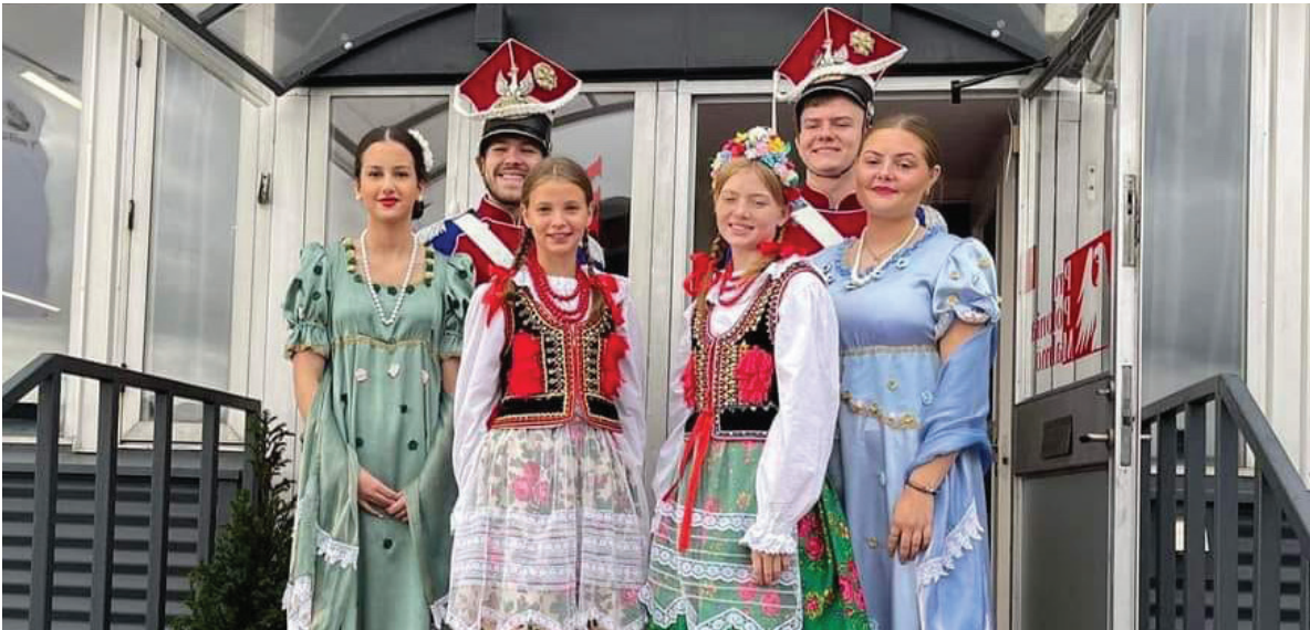
Inauguracja Domu Polonii nie mogła się odbyć bez naszej wspaniałej młodzieży z Ogniska „Kwiaty Polskie”.