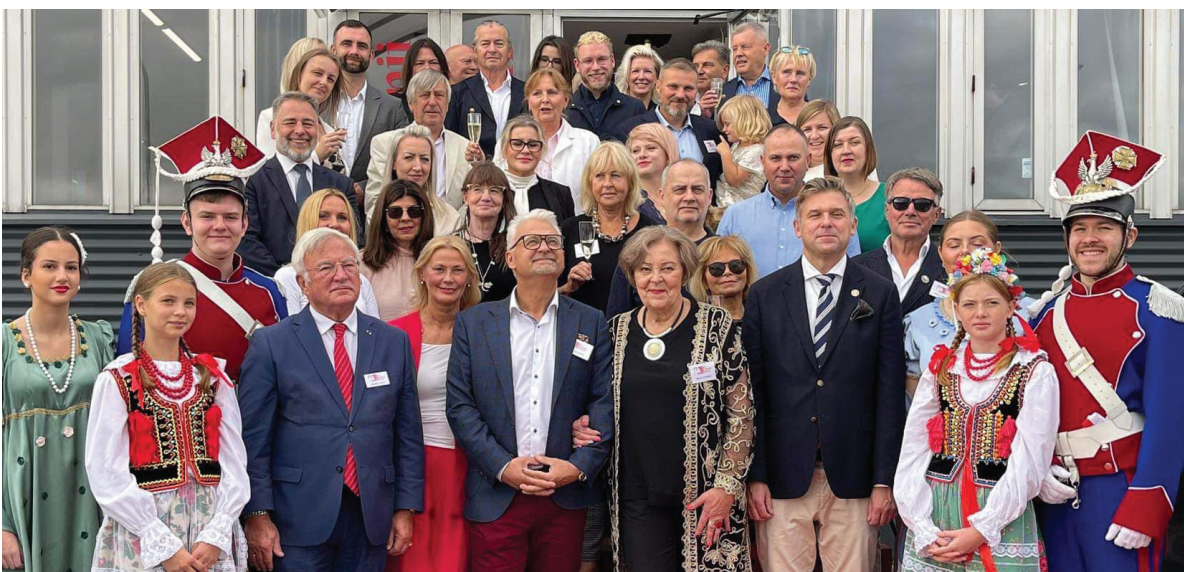
To tylko część gości podczas inauguracji Domu Polonii.