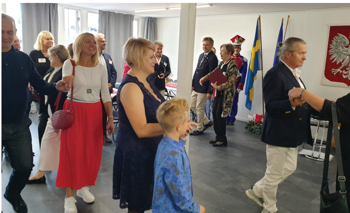
Członkowie Ogniska „Kwiaty Polskie” polonezem wprowadzili gości.