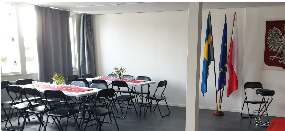
Dom Polonii czekał na gości.