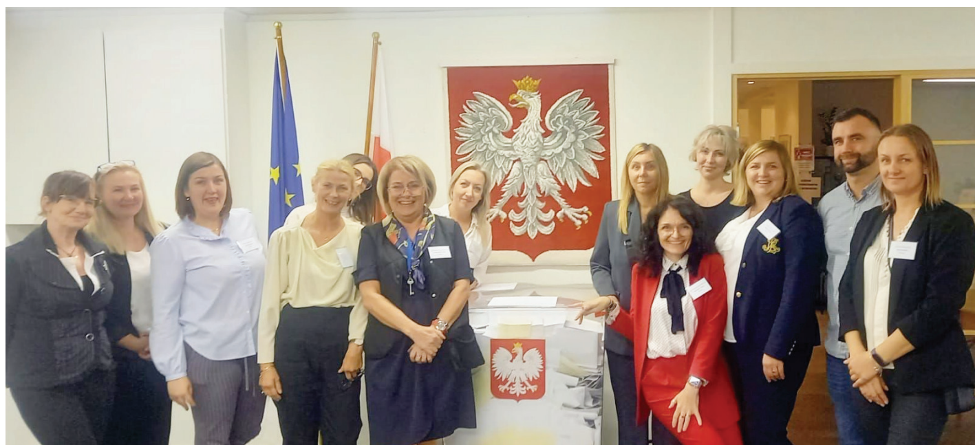
Obwodowa Komisja Wyborcza w Malmo w pełnym składzie. - Hela valkommittén i Malmö.

Tekst: ANNA PARADOWSKA