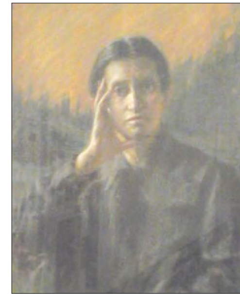
Portret Olgi Kobylańskiej, 1927 r.

Muzeum O. Kobylańskiej przechowuje również część twórczości A. Kochanowskiej - szkice, rysunki węglem, ilustracje w technice rips, pastelowy portret pisarki.