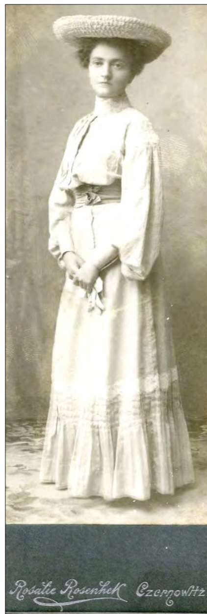
Zdjęcie zostało zrobione w Czerniowcach w 1888 roku.