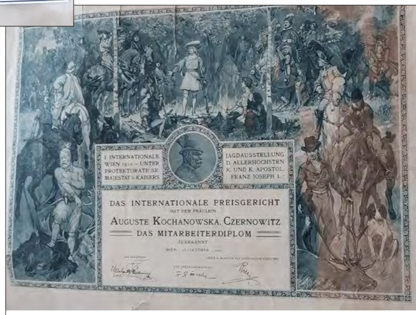
Dyplom ukończenia studiów w Wiedniu.