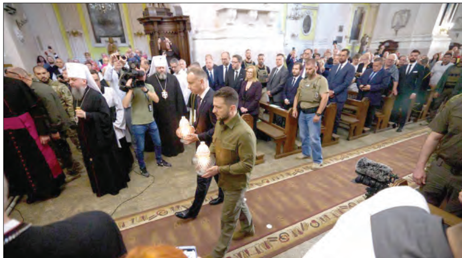
Wołodymyr Zełenski i Andrzej Duda odwiedzili katedrę świętych Piotra i Pawła w Łucku, gdzie wzięli udział w nabożeństwie ekumenicznym.

Po południu prezydent Zełenski wydał oświadczenie. «Rano spotkałem się z panem prezydentem Polski Andrzejem Dudą. Przeprowadziliśmy rozmowę. Msza święta. Byli przedstawiciele wszystkich wyznań i wspólnot religijnych. W łuckim kościele. Wraz z Andrzejem oddaliśmy hołd pamięci wszystkich