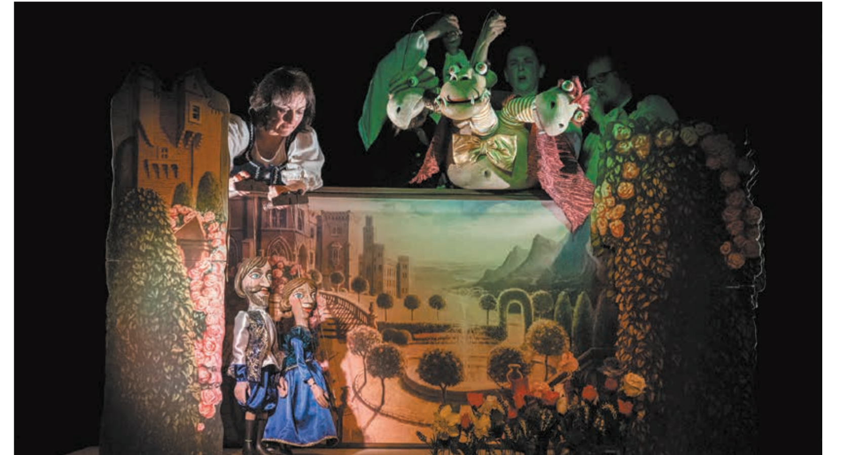
• Trzy krótkie historie w wykonaniu zespołu „Bajki” o losach trzech królowien są nie tylko zabawne, ale i niosą mądre przesłanie.

Drewniane klasyczne marionetki i prosta składana scenografia autorstwa Miroslava Duši to z jednej strony rozwiązanie, które ułatwi zespołowi podróżowanie (a „Bajka” dość często gra poza swoją siedzibą, także w plenerze), ale z drugiej strony stanowi wyzwanie dla aktorów. Animacja marionetki