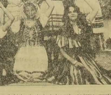
Grupa młodych Francuzów z Rowan...