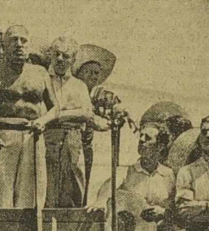
Dyktatorzy potrzebują reklamy i dlatego robią wszystko, by reklamować się możliwie najszersze. Mussolini ostatnio brał udział w zwiach, poczem wygłosił mowę, w której, skorzystawszy z tego fotografowali i dokonali napisanych zdjęć. Na obrazku Mussolini podczas przemówienia do dziurników w ozonowanych bagnach Pontyńskich, na swierze wybudowanej kolonii Apennin.

Równocześnie wezwano w dziedzinie tak bardzo w Austrii obecnie rozpowszechnionego donosicielstwa, dyktatorowi coraz to więcej osób wedrowało do aresztów. Donosicielstwo przysięgli byli przedsiobstwem i w wielkim sklepie w celach kontroli ich czynności, pobierając za to od tych przedsiobstwem wysokie pensje.