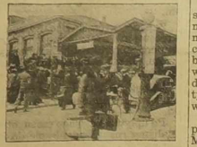
Przed dworcem w Toul.

stoi wzmnie przy sztafardzie narodowym pragnęliby zepchnąć go z tej drogi, aby przedstawiciwo w opani francuskiej jako element polityki i burżuazji. Niemiec te zamary im sie na szczeci nie udają i napotykały strony polskiego emigranta na zdecydowany opór.