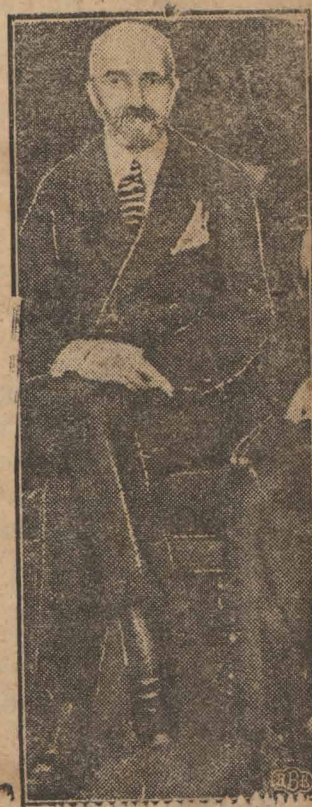
Premier Walery Sławek.

P. prezydent Ign. Mościcki odwiedził Częstochowę, o czym pisac będziemy w przyszłym numerze.