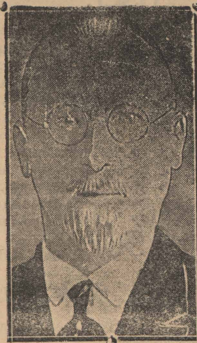
Jan Piłsudski, brat Marszałka

— Dnia 30-go został traktat handlowy niemiecko-polski w Berlinie przez reichstag potwierdzony. Niemcy są zdania, że zajście na granicy polsko-niemieckiej nie będzie miało żadnych poważnych następstw i będzie załatwione dla obu stron w sposób zadowalniający.