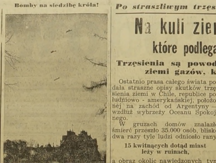
Bomby na siedzibę król!

W Łodzi jest 6 tys. przycięci Poloni Związku. Łódź. — Odbija się tu uroczyście akcja demontażu przycięci Poloni Związku. Komitet „Dnia Polaka z zagranicą” Na akademie przybył z Warszawy pre-