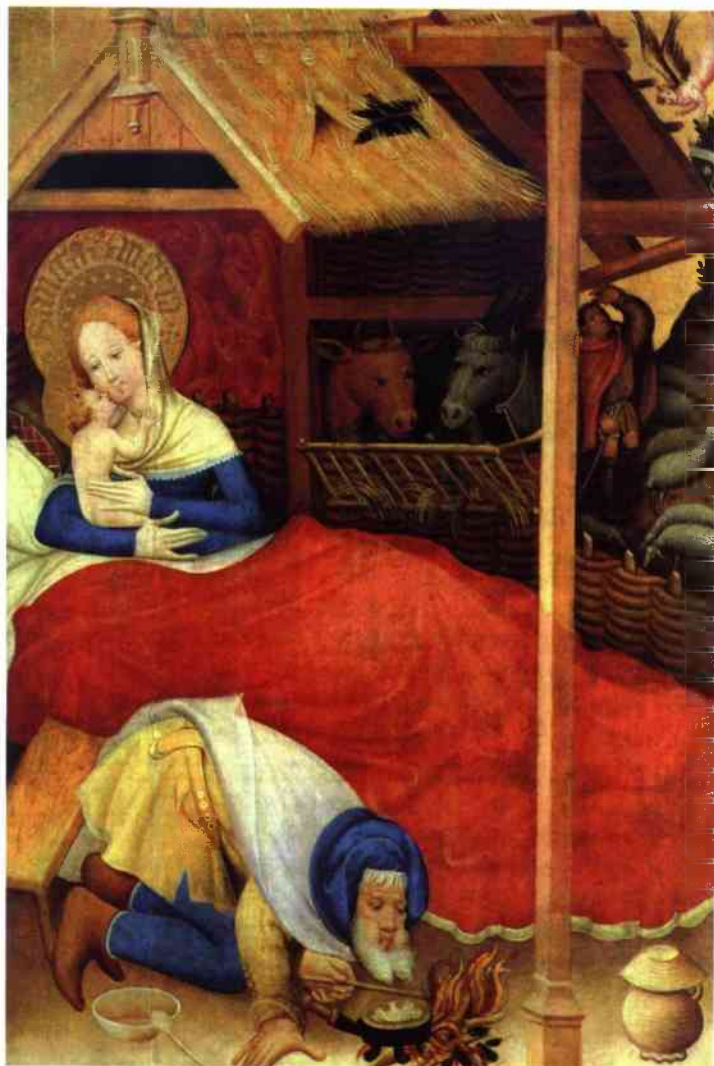
Konrad von Soest – „Boże Narodzenie”