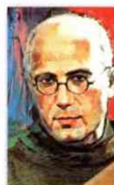
Św. Maksymilian Kolbe