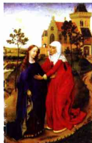
V. Weyden – Nawiedzenie

W tym czasie Maryja wybrała się i poszła z pośpiechem w górę do pewnego miasta w pokoleniu Judy. Weszła do domu Zachariasza i pozdrowiła Elżbietę. Gdy Elżbieta usłyszała pozdrowienie Maryi, poruszyło się dzieciątko w jej tonie, a Duch Święty napętnił Elżbietę. Wydała ona okrzyk i powiedziała: „Błogosławiona jesteś między niewiastami i błogosławiony jest owoc Twojego łona. A skądże mi to, że Matka mego Pana przychodzi do mnie? Oto, skoro głos Twego pozdrowienia zabrzmiał w moich uszach, poruszyło się z radości dzieciątko w tonie moim. Błogosławiona jesteś, któraś uwierzyła, że spełnią się słowa powiedziane Ci od Pana”.