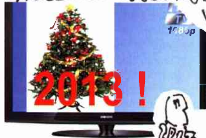
rys. Leszek Biernacki