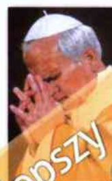
St. Jan Paweł II