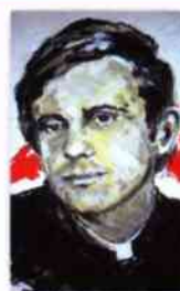
Bł. Jerzy Popiełuszko