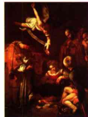
Caravaggio - Narodz. Pańskie

wszyscy, aby się dać zapisać, każdy do swego miasta. Udał się także Józef z Galilei, z miasta Nazaret, do Judei, do miasta Dawidowego, zwanego Betlejem, ponieważ pochodził z domu i rodu Dawida, żeby się dać zapisać z poślubioną sobie Maryją, która była brzemienna. Kiedy tam przebywali, nadszedł dla Marii czas rozwiązania. Porodziła swego pierworodnego Syna, owinięta Go w pieluszki i potoczyła w żłobie, gdyż nie było dla nich miejsca w gospodzie. W tej samej okolicy przebywali w polu pastersze i trzymali straż nocną nad swoim stadem. Naraz stanął przy nich anioł Pański i chwata Pańska zewsząd ich oświeciła, tak, że bardzo się przestraszyli. Lecz anioł rzekł do nich: „Nie bójcie się! Oto zwiastuję wam radość wielką, która będzie udziałem całego narodu; dziś w mieście Dawida narodził się wam Zbawiciel, którym jest Mesjasz Pan. A to będzie znakiem dla was: Znajdziecie Niemowlę, owinięte w pieluszki i leżące w żłobie”. I nagle przyłączyło się do anioła mnóstwo zastępów niebieskich, które wielbiły Boga słowami: „Chwata Bogu na wysokościach, a na ziemi pokój ludziom, w których ma upodobanie”.