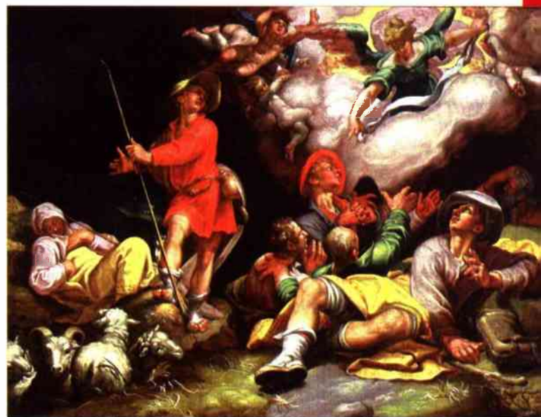
A. Bloemaert - Adoracja pasterzy (1600)

Kieruję do Was to krótkie słowo zamyślenia, pozdrowień, razem z życzeniami i błogostawieństwem na nadchodzące Święta Bożego Narodzenia. Pamiętamy w Polsce o Was, cieszymy się Waszymi radościami i sukcesami, wspieramy Was modlitwą w Waszych problemach, dziękujemy Wam za wielość pomocy, szczególnie duchowej, jaką niesiecie Ojczyźnie. Każdego dnia w czasie apelowej modlitwy na Jasnej Górze płynie także do Was błogosta-