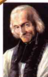
St Jean-Marie Vianney