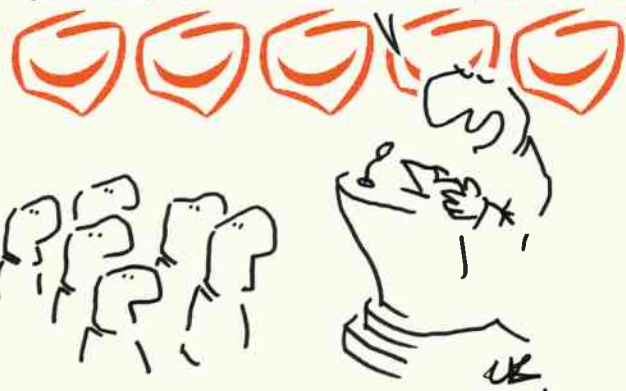
rys. Leszek Biernacki