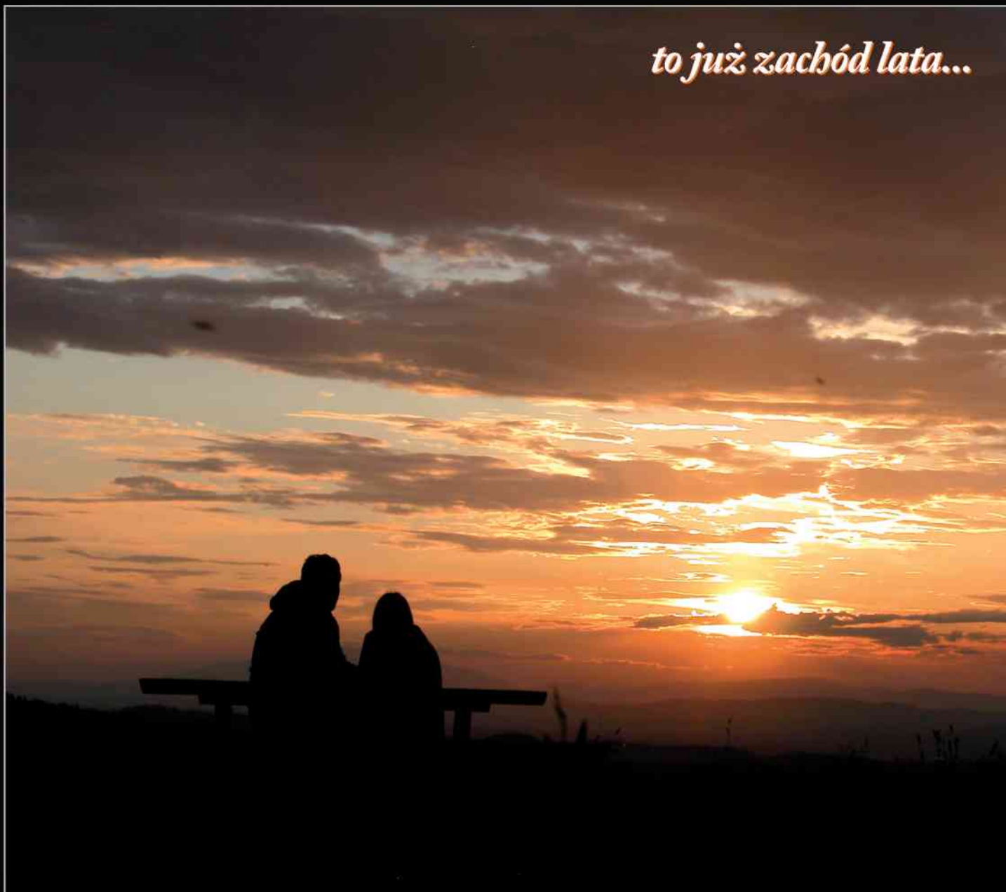
fol. G. Jędrzejowska