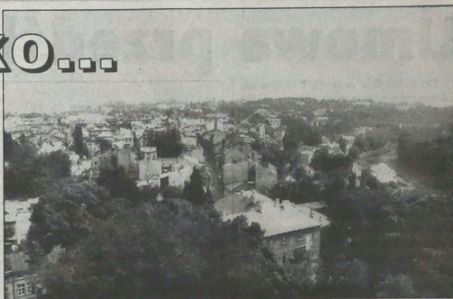
▲ Cieszyn z wieży piastowskiej.

■ ■ Przez cały czas mówimy o kulturze, którą się zwykło określać mianem - „wysoka”. Nie wspomnieliśmy jednak o tej porze o bardzo popularnej imprezie o bardziej festyno-