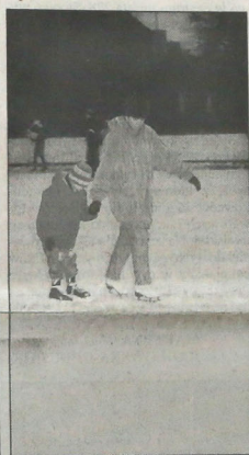
▲ Na szumarskim łodowisku w Czeskim Cieszynie.

„Na szczęście wszystko wskazuje na to, że sutereny wieżowców są obecnie w stanie nie wymagającym specjalnych, kosztownych zabiegów zabezpieczających” - powiedziała E. Dřová. „Lokatorzy musieli jedynie uprzątnąć piwniczne komórki, żeby można było sutereny skutecznie wietrzyć. Użytkując z tej ranej zniżkę czynszu. Wszystkie łazienki zatem domy są pod baczną obserwacją fachowców”.