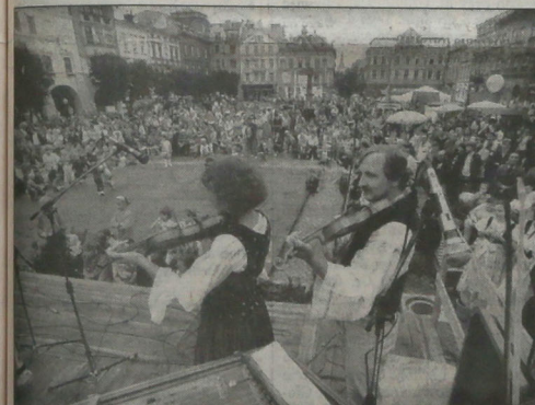
▲ Rynek w Cieszynie: Święto Trzech Braci.