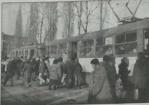
▲ Tłumy ludzi podążających do centrum Ostrawy po świąteczne zakupy to ławy cel kieszonkowców...

Nie sygnowane materiały publicystyczne i informacyjne pochodzą z satelitarnej serwisy informacyjnego Polskiej Agencji Prasowej.