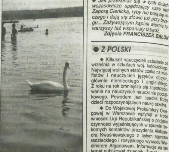
Jak przekonali się w tych dniach wczasowicze spędzający czas nad Zaporą Cierlicką, ryby nie boją się niczego i dają się złowić tuż przy brzegu... Zauważającym kąpiel wierznie towarzyszy też wspaniały labełż.