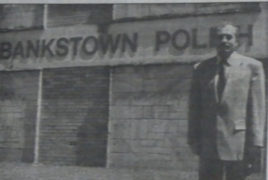
▲ Konsul generalny RP w Sydney - minister Wiesław Osuchowski ▶ Dom Polski w Sydney (z prawej).

ganizowanie spotkania wszystkich trzynastu zainteresowanych przyjazdem polskich sportowców do Australii na kilka tygodni przed rozpoczęciem igrzysk. Dążyć im to możliwości lepszego przygotowania się do startu w nowym klimacie - tak różnym przecież od polskiego. Z drugiej też strony polscy sportowcy mogliby wówczas poznać lepiej Australię i spotkać się z tamtejszą Polonią.