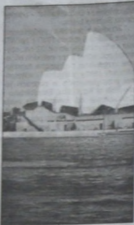
▲ Budynek opery w Sydney

Obu stronom już dziś ogromnie zależy na tym, aby odpowiednio dobrze wykorzystać czas przed olimpiadą. Niezmiernie ważne byłoby tu zor-