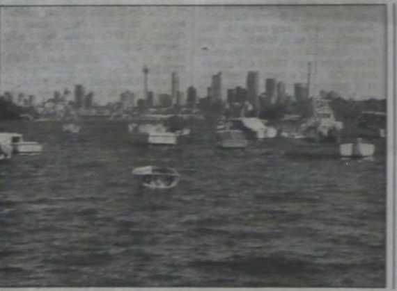
▼ Centrum Sydney od strony Zatoki Portowej.