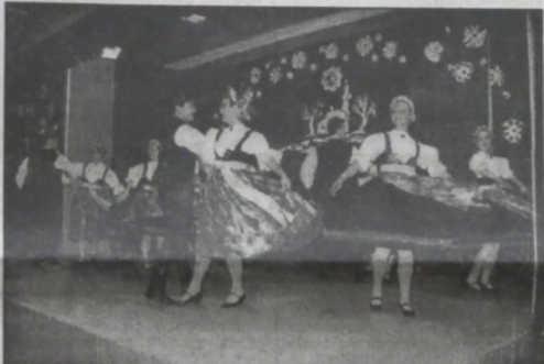
▲ ZPIT "Olza" na scenie dolnolutynskiego Domu Kultury. Perfekcyjnie wykonany program publiczności nagrodziła gorącymi oklaskami.