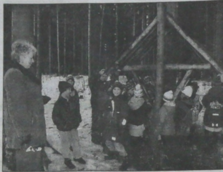
▲ Uczniowie drugiej klasy szkoły podstawowej przy ul. Jaroša w Hawierzowie-Szumbarcu co tydzień przychodzą do pobliskiego Lasu Piatwałdzkiego dokarmiać leśną zwierzynę, której tegoroczna zima znowa dała się mocno we znaki. Przynoszą reszki czerstwego chleba, ale także owoce i warzywa. Po drodze uczą się nazw drzew i krzewów.

nie wydane materiały publicystyczne i informacyjne pochodzą z satelitarnej sieci informacyjnej Polskiej Agencji Prasowej lub z „Magazynu PAP”.