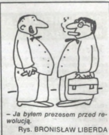
- Ja byłem prezesem przed rewalucją. Rys. BRONISŁAW LIBERDA