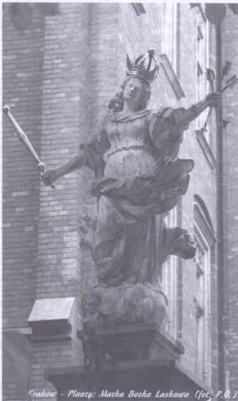
Arakawa - Planty: Matka Bosha Łaskawa

choć nie była wtedy Matką Boga. Bóg jednak, ze względu na przyszłe zbawcze wydarzenia, uchronił Maryję przed grzesznością. Maryja była więc poczęta w łasce uświęcającej, wolna od wszelkich konsekwencji wynikających z grzechu pierwotnego (np. śmierci, stąd w Kościele obchodzimy uroczystość Jej Wniebowzięcia, a nie śmierci). Przywilej ten nie odnosił się jedynie do grzechu pierwotnego, a posiadał dużo szerszy wymiar, który wyrażał się pełnią łaski w życiu Maryi.