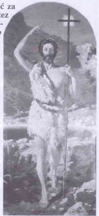
St. Witkiewicz - Jan Chrzciciel (Zakopane - 1897-1900)

ciela jest napomnieniem i wyrzutem. Przygotujcie drogę Panu, prostujcie ścieżki dla Niego. Bardzo wiele przeszkód znajduje się w naszym życiu na tej drodze dla Pana. Każdy z nas najlepiej zna te przeszkody, które musi w sobie pokonać. Jeżeli dokładnie ich nie widzimy, jeżeli nie wiemy co robić i nad czym pracować, to właśnie Adwent, który przeżywamy powinien być dla nas czasem pogłębionej refleksji. Starajmy się lepiej poznać swoje postępowanie i dostrzec przeszkody, które zagradzają Bogu drogę do naszego serca, aby te przeszkody usunąć. Zmieniajmy sposób naszego postępowania, zwracajmy się ku temu, co dobre, bo Adwent to przede wszystkim czas nawrócenia. To nawrócenie, szczerzy żal związany z poprawą postępowania jest przecież warunkiem odpuszczenia grzechów, by z czystym sercem przyjąć Zbawiciela do swego serca.