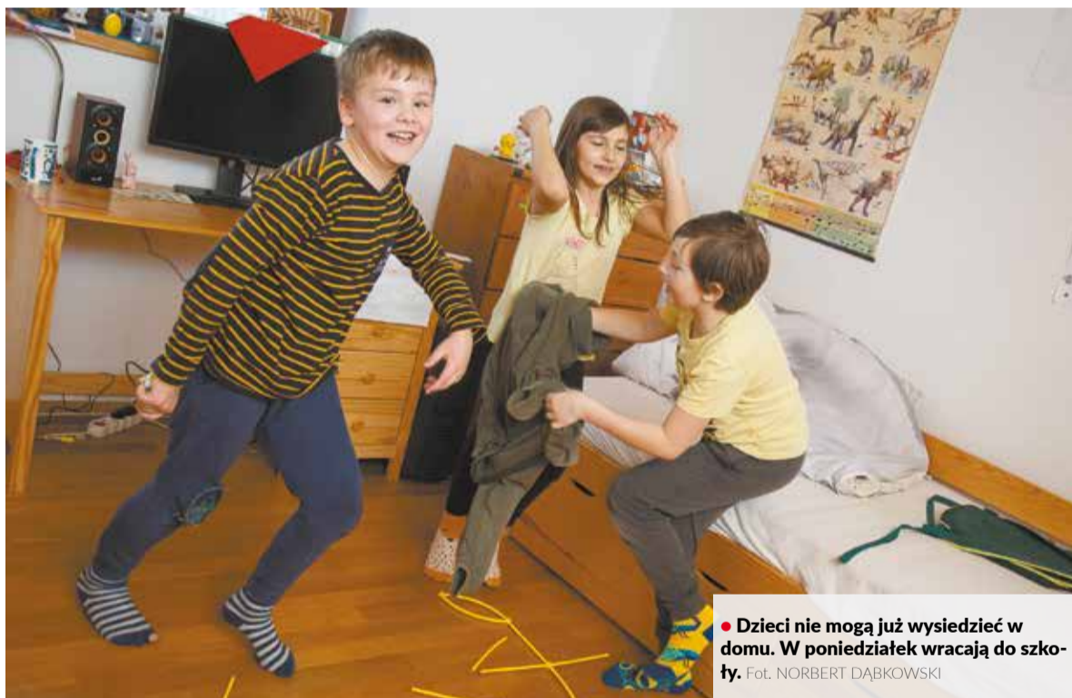
• Dzieci nie mogą już wysiedzieć w domu. W poniedziałek wracają do szkoły.

W polskich podstawówkach w Lutyni Dolnej i Hawierzowie-Błędowicach liczba uczniów w klasach 1.-5. nie przekracza 75. To jednak nie powód, żeby od poniedziałku przywitać w murach szkolnych zarówno