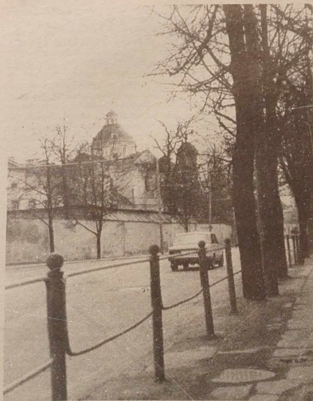
MIGAWKI WILEŃSKIE. Ulica Antokolska.