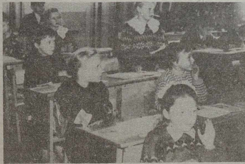
Podczas, gdy uczniowie drugiej klasy dzielą się swoją wiedzą o spółgłoskach i samogłoskach, czwartacy pochylili się pracownicy nad zeszytami.