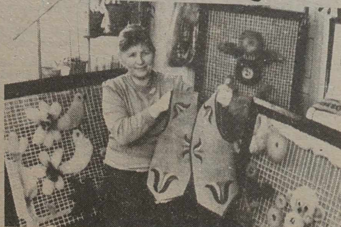
je odpowiednio, wyszło z tego 16 albumów...