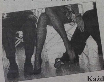
czasami oprócz wymiany spojrzeń i rozmowy, równoległe „pozyskiwanie łask partnera” rozgrywa się pod stolikami.

Jak pisze Bogdan Wojciszke w swojej książce, miłosna namietność łatwiej się rodzi w sytuacji, gdy człowiek przeżywa pobudzenie emocjonalne. Czyli, mówiąc po ludzku - jeśli uratujesz ją spod kół pedałowego tramwaju, natkniesz się na nią u weterynarza u węgłowa chorego kota lub poznasz ją podczas strajku, miłość, szczybiec uderzy wam do głowy.