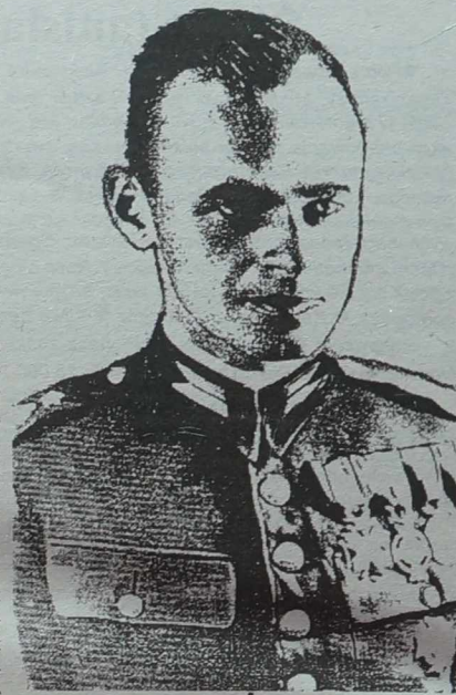
WITOLD PILECKI I. 46 OCHOTNIK W WOJNIE O NIEPODLEGŁOŚĆ W 1920 R. OFICER 13 PUŁ. ULANÓW, ŻOŁNIERZ AK DOBROWOLNY WIĘZIEŃ OŚWIECIMIA I TWÓRCA TAJNEJ ORG. WOJSK. WIEŻNIÓW 1940-43 UCZESTNIK POWSTANIA WARSZAWSKIEGO WIEZIEŃ OFLAGÓW W LAMSDORF I MURNAU STRACONY W WARSZAWIE W 1948 R.

(Przedruk z „Biuletynu informacyjnego” - pisma ZG Świątowego Związku Żołnierzy AK w Warszawie).