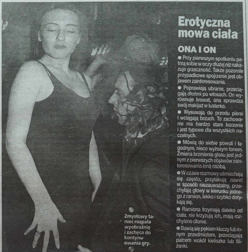
Zmysłowy tańiec rozpała wyobraźnię i zachęca do kontynuowania gry.

Przygotowała: Katarzyna RUTKOŃSKA („Fokus”)