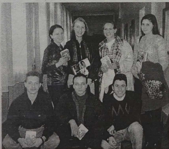
Uczniowie Wileńskiej Szkoły Średniej im. Szymona Konarskiego

Żyjemy nadzieje, że nasz apel o zachowanie i rozwijanie polskiego szkolnictwa na Litwie zostanie usłyszane również przez Polonję światła, która prosimy na miarę możliwości wesprzeć polskie szkolnictwo na Litwie.