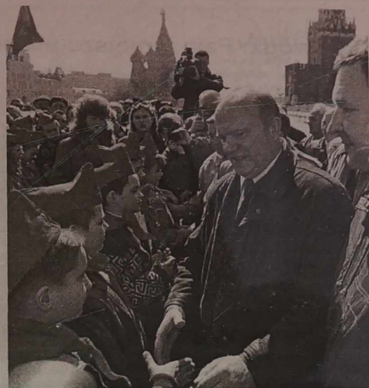
NA ZDJĘCIU: lider komunistów przed mauzoleum Lenina w Moskwie

W dużej mierze zależeć to będzie od wyników zakulisowych rozmów między przedstawicielami prezydenta i rządu a komunistami i ich sojusznikami, które trwają w kulisach.