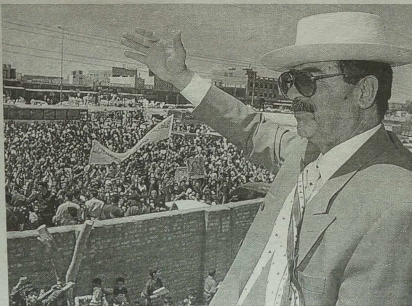
NA ZDJĘCIU: wiec w Bagdadzie, który odbył się wczoraj

Apel do Dumy w tej sprawie Rada Federacji zawarła w rezolucji, którą poparło 111 członków izby wyższej. Jedyne 10 było przeciwnych.