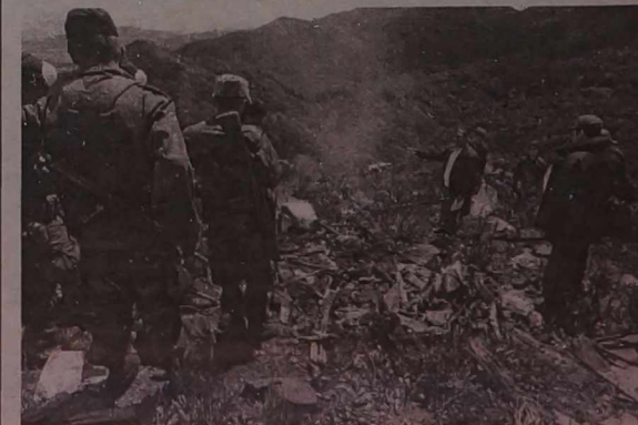
NA ZDJĘCIU: na miejsce katastrofy

Amway rozpoczął działalność w Chinach trzy lata temu. Ostatnio zainwestował 100 mln dolarów w osiem hurtowni oraz w fabrykę w Guangzhou w prowincji Guangdong.