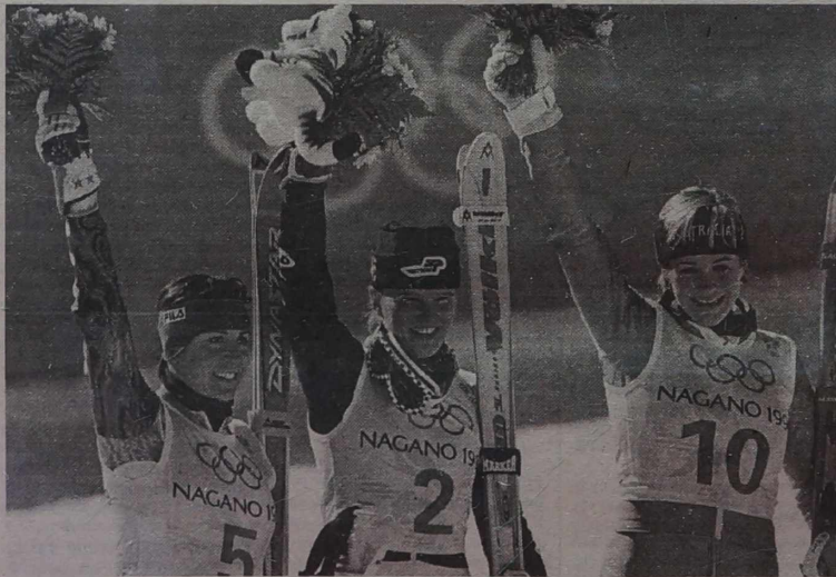
Na podium medalistki w olimpijskim slalomie kobiet.

Kolumnę przygotował Mieczysław RADZIWIŁŁOWICZ