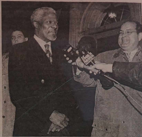
NA ZDJĘCIU: Kofi Annan wierzy w sukces swej misji, co pozwoli uratować pokój.

Mówiąc o pozytywnych sygnałach ze strony USA sekretarz generalny ONZ poinformował, że przed podróżą do Bagdadu rozmawiał przez telefon z prezydentem Bilem Clintonem, który kilka razy podkreślił, iż opowiada się za dyplomatycznym rozwiązaniem kryzysu irackiego.