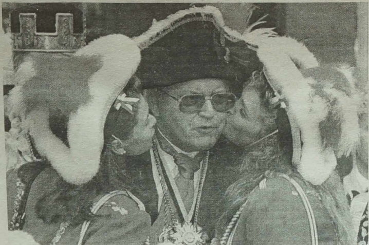
NA ZDJĘCIU: za chwilę te piękne kobiety utną „zwis męski” rozmarzonymu facetowi...

Ostatni czwartek karnawału nie jest w Niemczech „lusty”, ale raczej „kobiecy”. „Weiberfastnacht” to zapusty białogłów lub w zupełnie wolnym tłumaczeniu zapusty czwartek kobitek.