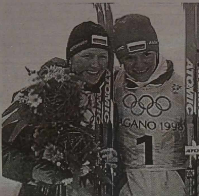
Dwukrotna mistrzyni olimpijska z Nagano Rosjanka Larisa Łazutina.