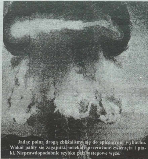
Jadąc polną drogą zbliżyliśmy się do epicentrum wybuchu. Wokół palily się zagajniki, uciekały przerażone zwierzęta i ptaki. Nieprawdopodobnie szybko pelżyły stepowe węże.