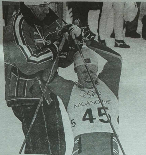
Sześciokrotny złoty medalista olimpijski Norweg Bjoern Daehlie.