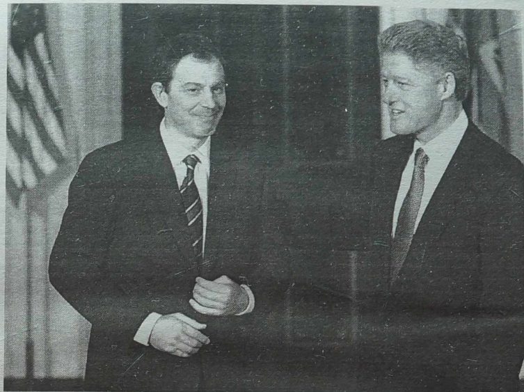
NA ZDJĘCIU: Premier Tony Blair podczas rozmów o kryzysie irackim z Billem Clintonem. Waszyngton, Białe Domy.

W Waszyngtonie brytyjski premier ma się spotkać z dyrektorem Międzynarodowego Funduszu Walutowego Michele Camdessus, ministrem skarbu USA Robertem Rubinem i przewodniczącym Urzędu Rezerwy Federalnej USA (banku centralnego) Alanem Greenspanem.