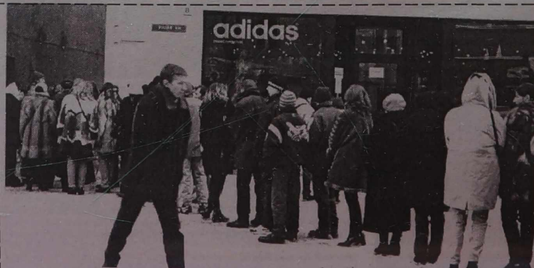
Kolejka w Wilnie - rzadki to ostatnio widok. A jednak w tych dniach na ulicy Zamkowej ustawiła się na dobrych kilkaset metrów. Młodzież lubi obuwie i odzież „Adidasu”, tym bardziej, gdy jest objęta rabatem około 50 proc.

Klientom upadłego banku „Tauras” kompensaty wypłaca się nie z budżetu państwowego, lecz z Funduszu Ubezpieczenia Oszczędności. (BNS)