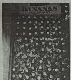
We wsi Bajorai (gmina rzeszajska) zatrzymano i skonfiskowano partię „pilstukasu”

Uliczny pregiarz Wolanie o pomoc ściągnięto grupę przechodniów na boczną uliczkę w Chead-heaton w Anglii. Zdumieni