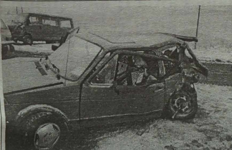
Kraksa na sosie wilkomierskiej