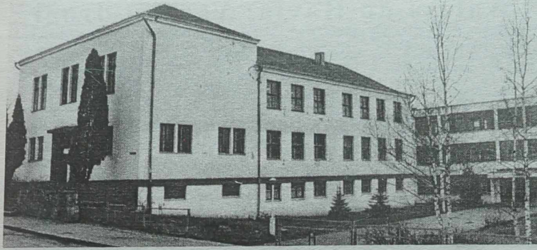
NA ZDJĘCIU: szkoła jerozolimka.