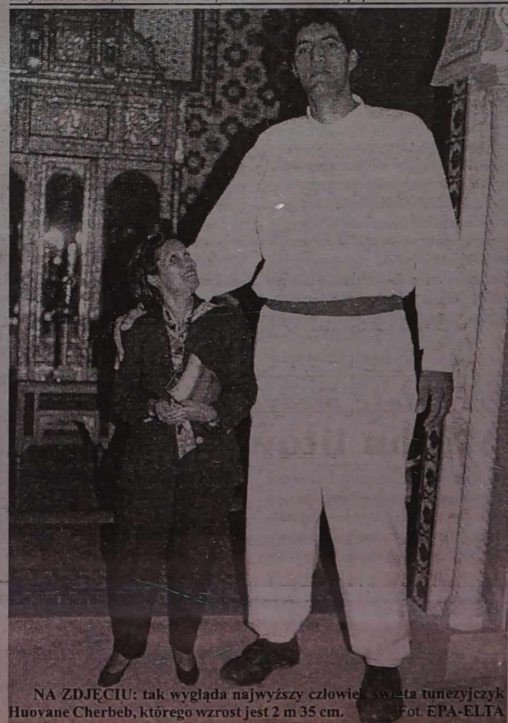
NA ZDJĘCIU: tak wygląda najwyższy człowiek świata tunezyjski Huovane Cherbeb, którego wzrost jest 2 m 35 cm.

W poniedziałek w Wuerzburgu episkopat niemiecki będzie dyskutował nad listem papieża.