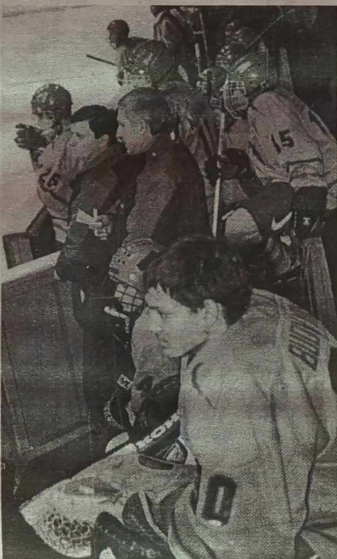
- drużyna Litwy razem z kierownictwem po wręczeniu nagród; atakują hokeiści Litwy; trenerzy R. Sidaravicius i W. Charitonow dają wskazówki.