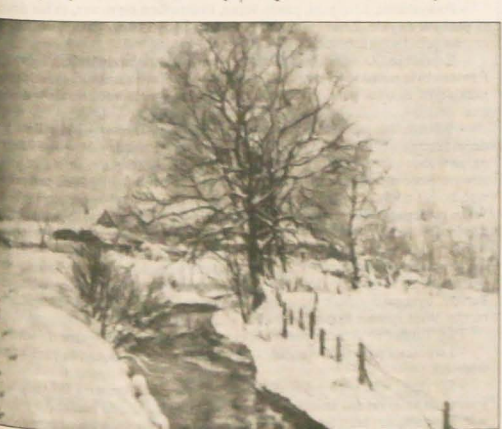
Dominik Figurny: Zima nad Młynką. Olej, 1956.

Urodził się 29 lipca 1909 roku w Suchej Górnej. Po ukończeniu służby podstawowej kłopoty z emeryturą. Po ukończeniu służby podstawowej kłopoty z emeryturą. Po ukończeniu służby podstawowej kłopoty z emeryturą. Po ukończeniu służby podstawowej kłopoty z emeryturą.