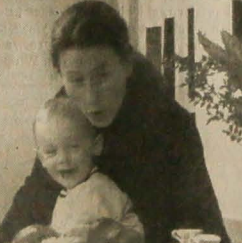
Mogą jednak powstać pewne nieprawidłowe nawyki. Dziecko ma prawo zamiać „s” mówić „sz”, ale jeśli przy tym wsuwa język między zęby, to nie uważa się błędem.

Wielu rodziców, obserwując rozwój mowy swojego dziecka, zadaje sobie pytanie, czy wszystko przebiega prawidłowo. Porównują je z rówieśnikami, przypominają sobie, jak mówiło rodzeństwo, kiedy było w podobnym wieku. Czasami niepokoi ich zniekształcenie głosu, dziwne ich brzmienie, zastępowanie właściwych głosek innymi czy trudna do zrozumienia wymowa.