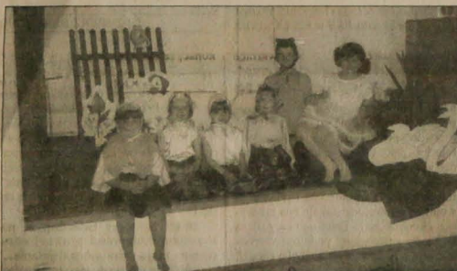
▲ Z przedstawienia dolnośląskich dzieci »Brydki kaczątko«.

Wierzę, że dolnośląskie przedszkolaczki dotrą szczęśliwie do miasteczka, gdzie kozy kują, a tymczasem przeczytajcie o wędrowaniu po Polsce.