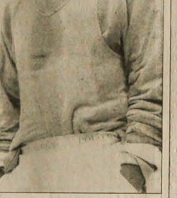
Kolumnę przygotowała: WANDA KULA

aby jednak użyć naszym cierpieniem, proponujemy prosty zestaw: spodnie z lżejszej niemieckiej siły wlny, koszulki z bawełny.