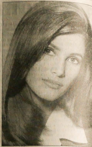
Włosy i skórę głowy. Poprawa mikrokrążenia, odżywienie cebulek, zapobieganie łupieżowi. Dla wzmocnienia efektów kuracji codziennie wieczorem pij filiżankę herbatki ze skrzypu polnego.

Trzy łyżki korzenia łopianu zalej w słoiku dwiema szklankami czystej wody. Po 2 tygodniach przecedź, wciuraj w skórę głowy.