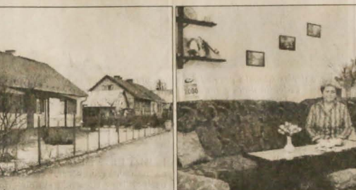
Wielki mieszkanek pałkowskiego osiedla. W podkolkowickiej kolonii na sąsiadów nie trzeba narzekać. Ludzie się tu znają, od lat sąsiedują ze sobą, wspólnie powoli starzeją się... Działają w fińszczokach nie brakuje szczęśliwców, siedemdziesięciolatków. Młodych rodzin z małymi dziećmi jest niewiele. Nie oznacza to jednak, że dla młodych rodzin mieszkanie w fińszczoku konieczne musi być mało atrakcyjne. „Ja spokojnie posłabym tu mieszkać. Pół fińskiego domku to w sam raz dla młodej rodziny z dzieckiem. Lepsze to niż w bloku, gdzie za mieszkanie ze wszystkimi opłatami mieszkanie wydam ponad trzy tysiące. Tutaj mam ogródek, a jakby zainwestować trochę pieniędzy, z zwykłego fińszczoka można zrobić super domek” - stwierdza dwudziestod-

row dzieli jej dom od komisariatu policji.