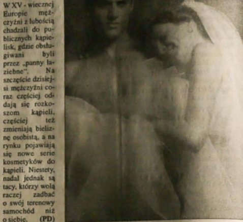
Kolumnę przygotowała: WANDA KULA

W XV - wiecznej Europie mężczyźni z lubością chadzali do publicznych kapieli, gdzie obsługiwani byli przez „panny laziebne”. Na szczęście dzisiejsi mężczyźni coraz częściej oddają się rozkoszom kąpieli, częściej też zmieniają bieliznę osobistą, a na rynku pojawiają się nowe serie kosmetyków do kąpieli. Niestety, nadal jednak są tacy, którzy wolą raczej zadbać o swój tereny samochod niż o siebie. (PD)