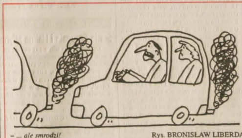
Rys. BRONISŁAW LIBERDA

NIEDZIELA - Nadal pochmurno. Temperatura nocą od 2 do -2 st., w dzień od 0 do 4 st. C. Wiatr północny 3-6 msek.