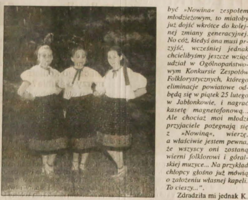
▲ Kapeli zawsze towarzyszą trzy sympatyczne solistki.