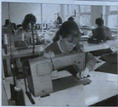
▲ W nowym hawierzowskim inkubatorze biznesu zatrudniona jest już firma „Irea”. Dwa dziesiątki kobiet szyje tutaj odzież, roboczą dla potrzeb placówek zdrowia.