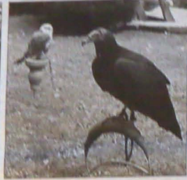
Sowa płomykowska, puchacz i kondor (w głębi pustkowi).