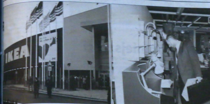
Miasteczko ściągającym ludzi do nowego Shopping Parku jest bez wątpienia czeski Dom Meblowy „Ikea”.