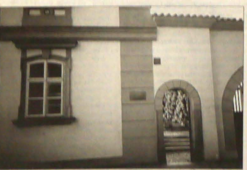
Wjeście do domu rodzinnego A. Dwořaka.

Jednakże 4 września, przypominamy sobie rocznicę urodzin wielkiego polskiego poety i dramaturga romantycznego, Juliusza Słowackiego. Chociaż nie pisał on dla dzieci, jego wiersze chętnie byływy recytatorskich na konkursach recytacyjnych. Urodził się w 1809 roku w Krzemieńcu, studiował na uniwersytecie w Wilnie, a od r. 1831 przebywał poza krajem - w Szwajcarii, we Włoszech oraz w Paryżu, gdzie w roku 1849 zmarł. W roku 1927 jego trumna wróciła do kraju i Słowacki spoczął w krypcie królewskiej na Wawelu. Najbardziej znane jego