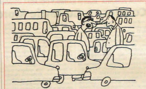
— Kupiłbym samochód, ale już nie ma dla niego miejsca. Rys. BRONISŁAW LIBERDA