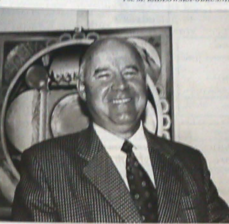
Marcin Tyrna, wicemarszałek Senatu RP, w rozmowie z autorką.

Ważność polskiej demokracji przesunęło się w lewo. Z przykrością stwierdzam, że ugrupowania lewicowe mają w swoich programach postulat likwidacji Senatu. Chcą przesunąć sprawy polonijnych na poziom konsula