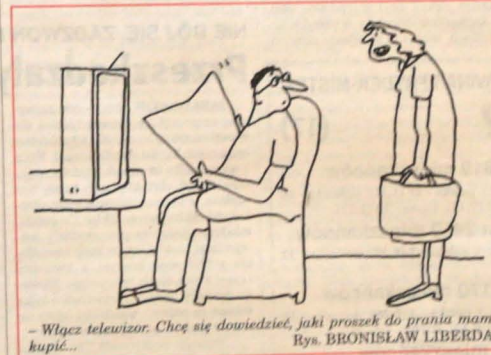
- Włazc telewizor. Chcę się dowiedzieć, jaki proszek do prania mam kupić... Rys. BRONISŁAW LIBERDA

Przy podejmowaniu decyzji komisja, choć nie było to wyraźnie zaznaczone w anonsie prasowym, brała w kandydatów pod uwagę znajomość języka polskiego.