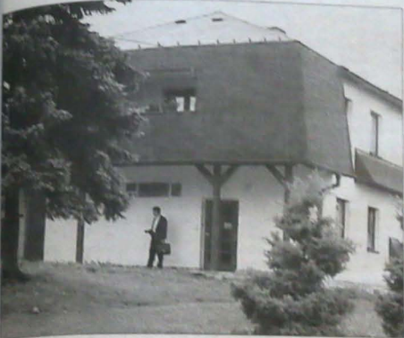
Używanym w pobliżu szkoły i Domu PZKO budynek Urzędu Gminnego w Mi- likowiu po przebudowie pomieści nie tylko biura, ale także punkt usług dla obywateli.