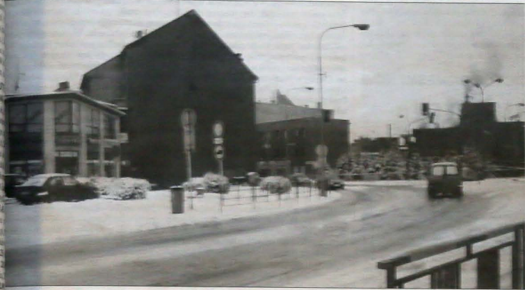
Nawalnica śnieżna, która rozpętała się w czwartkowe przedpołudnie, zamieniła w ciągu kilkadziesiąt minut w ślizgocę ulicę Trzinec.