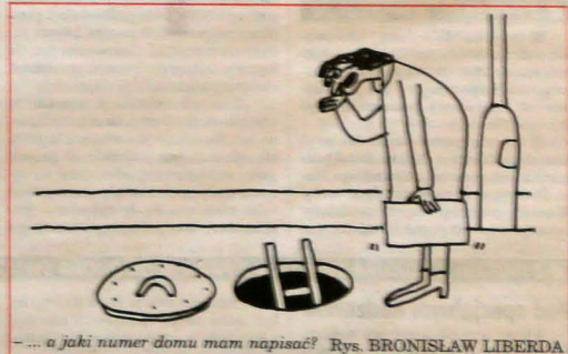
... a jaki numer domu mam napisać? Rys. BRONISŁAW LIBERDA