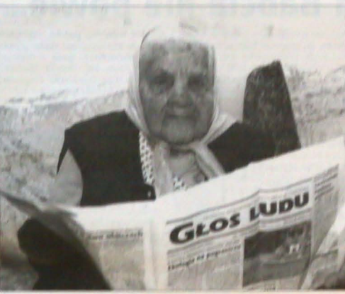
▲ „Głos Ludu” czyta od deski do deski. Wzruszyła się bardzo, kiedy w jednym z ostatnich numerów wspomniano jej 102. urodziny.