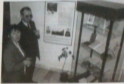
▲ Ciepły wykład... W S. Reymont 1867-1925... Wzrost i rozwój człowieka...