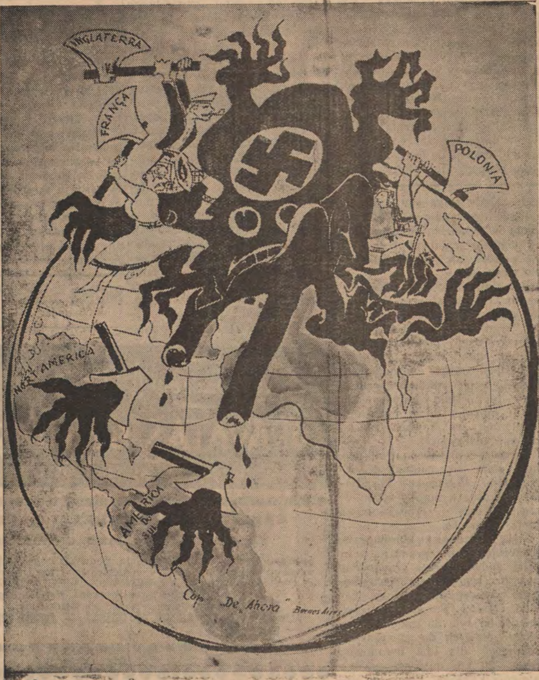
Osmiornica krzyża łamanego, wyciągająca zaborcze rami ona z Berlina na cały świat. Ilustracja pochodzi z pisma argentyńskiego „Aho ra”. Z zachodu odcina macki osmiornicy Anglia i Francja, od wschodu Polska. Dwie najdłuższe, złodziejskie ramiona, które chwytają łapami oba kontynenty Ameryki — już odcięte.

Wielkość jej ma w sobie coś czynnego. Świat cały darzył serdecznością ten naród, którego artyści i uczeni, wygnani z ojczyzny, prosili po świecie za Polską. Dziś, jak i wczoraj, ziemia polska napadnięta, daje światu znów godny a smutny widok swego męczeństwa!