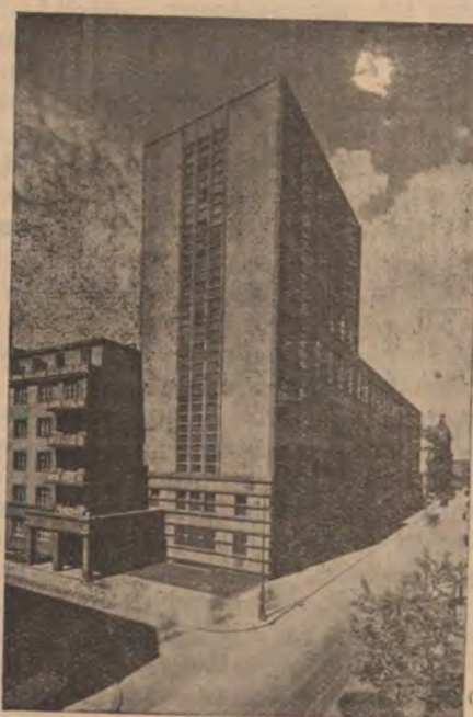
Gmach telefonów w Warszawie

Istnieją miasta, które spełniły swą rolę w dziejach Narodu, miasta — mauzolea, w których przez długie wieki gromadził Naród, to co ma najdroższego, aby zamknięte w kamieniu murów przetrwało wieki, miasta, po których chodzący nieledwie z odkrytą głową, z sercem ściśniętym szacunkiem i umiłowaniem dla bohaterskiej przeszłości. Takim miastem jest w Rzeczypospolitej Kraków.