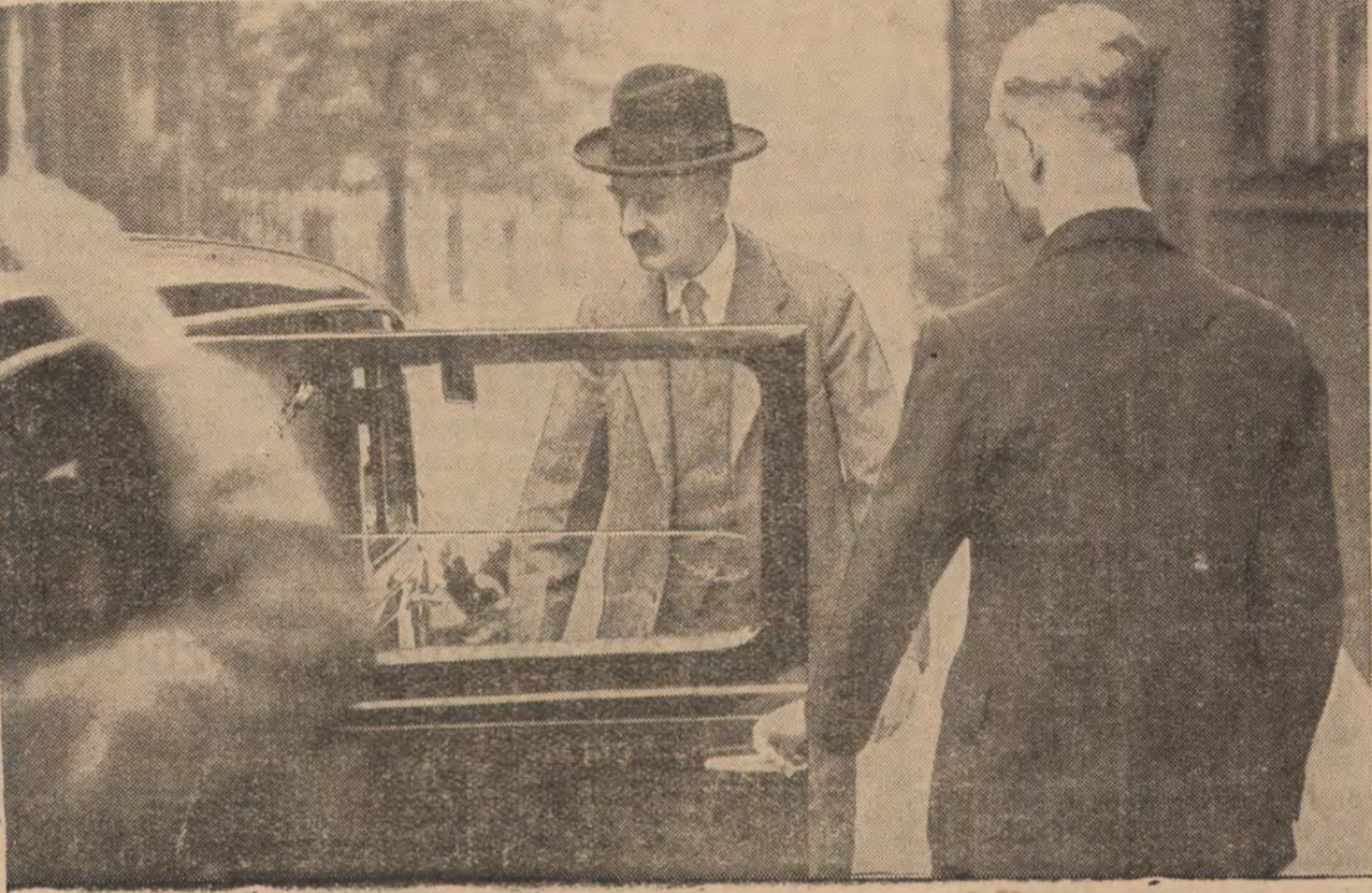
CHAMBERLAIN W DRODZE DO IZBY GMIN

no futuro da Patria, que se desvela pelo bem do Brasil, que promove a felicidade dos brasileiros e que teve a coragem de romper com os erros do passado, para reformar o sistema de governo do país num ato de alta significação, prestigiado pelas forças armadas, fortalecido pela opinião pública, dando orientação nova à vida brasileira. Brasileiros! Eis aí o regime que convém ao Brasil e o Chefe que convém ao regime: O Estado Novo e Getúlio Vargas. O regime forte e o Chefe enérgico e sereno, o regime correspondendo aos reclamos da consciência nacional e o Chefe correspondendo ao espírito e às necessidades do regime.