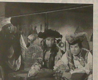
▲ Niezapomniany Zbigniew Cybulski (na zdjęciu pierwszy z prawej) zagrał w „Rękopisie znalezionym w Saragossie” reżysera W. J. Hasa postać Alfonsa van Wordena - kapitana gwardii króla Hiszpanii.