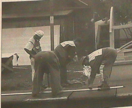
▲ W piątek pokrywano daszki nad schodami prowadzącymi do podziemnego przejścia dla pieszych przy wędryńskiej stacji kolejowej.

Nie sygnowane materiały publicystyczne i informacyjne pochodzą z satelitarnego serwisu informacyjnego Polskiej Agencji Prasowej.