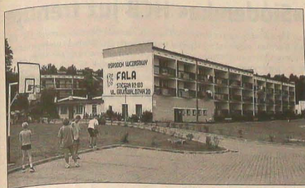
Stegna Gdańska.