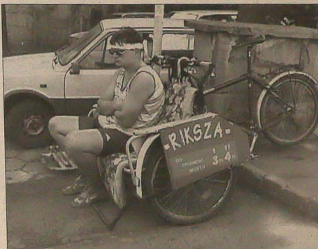
▲ Pierwszy riksarz przewożący pasażerów specjalnie dostosowanym do tego celu rowerem pojawił się w Cieszynie dwa lata temu. Jego trasa dostosowana była raczej do turystów, którzy chcą zwiedzać miasto. Kolejnik kierowy tych - charakterystycznych raczej dla odległych miast azjatyckich - „taksówek” nastawili się na innego klienta. Kursują wzdłuż Olzy między przejściami granicznymi. Jedna przejażdżka kosztuje pasażera 3 złote, pokonanie trasy w obie strony 4 złote. Trasa wydaje się jak stworzona dla „mrowek alkoholowych” przekraczających wiele kilometrów dziennie oba mosty graniczne... Do riksarzy na razie długie kolejeki się nie ustawiają, ale widać, że są chętni, wśród nich osoby przybywające na zakupy na pobliskie targowisko. (db)

Po powrocie z zagranicznych wojaży czeka „olzian” kolejne zgrupowanie oraz - 18 sierpnia - samodzielny koncert w Jastrzębiu-Zdroju. Nowy rok szkolny rozpocznie zaś „Olza” od występu na Śląskich Dniach w Łonnej Dolnej, gdzie na obu scenach zaprezentuje tańce mieszczan cieszyńskich oraz górali żywieckich.