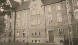
▲ Drawsko Pomorskie.