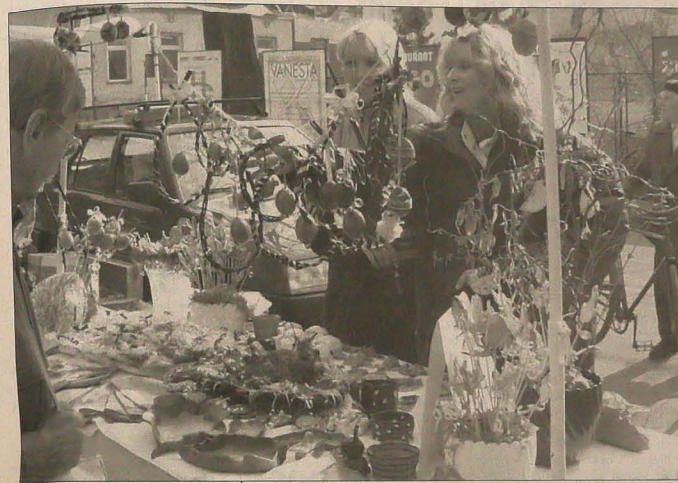
▲ Tradycyjny wielkanocny jarmark urządziła w czwartek bogumińska Agencja Kulturalna „Radost” (K.A.R.). Ludzie oblegali stoiska ze świątecznymi wiktuałami, można też było kupić przepiękne rękodzieła z drewna, skóry, haftowane obrusy i inne robotki ręczne, zabawki, kwiaty. Ogromnym zainteresowaniem cieszył się mini-warsztat, w którym arcycejkawy pokazywała wytwórnia papieru czerpanego z Wielkich Łosin. Nie zabrakło na jarmarku atrakcji dla dzieci - były konkursy, teatryk kukielkowy i starszeńska karuzela, były wreszcie żywe, kochające się z Wielkanocą, zwierzęta: baranki, pisklęta, króliczki.

PROMOCJA NAJNOWSZEJ PŁYTY »Arzia«, czyli »Wciąż ci sami...« Strona 5